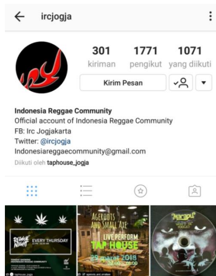
Gambar 2. 5 Instagram Indonesia Reggae Community

gaya reggae. Komunitas ini melakukan perform setiap hari Kamis di Taphouse Beer Garden. Sejak April 2017.