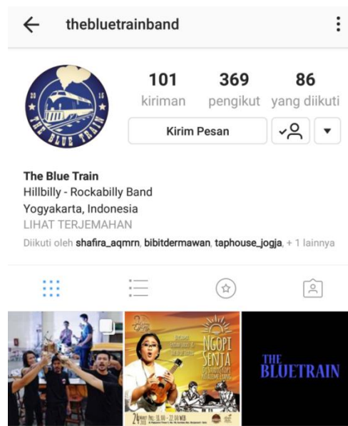
Gambar 2. 3 Instagram The Blue Train

dikarenakan salah satu personilnya keluar. The Blue Train melakukan perform setiap hari Minggu di Taphouse Beer Garden , selain melakukan perform di Tap band ini biasanya tampil di panggung-panggung acara lokal maupun café-café yang ada di Jogjakarta.