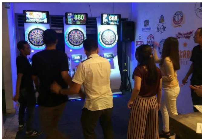
Gambar 2. 2 Pengunjung sedang menggunakan fasilitas permainan darts