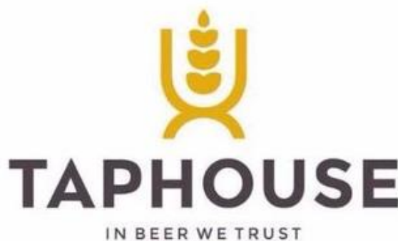
Gambar 2. 1 Logo Taphouse Beer Garden

Perkembangan kafe di Jogjakarta yang memiliki konsep bar dan lounge semakin menjamur, hal ini bisa dilihat dari banyaknya kafe berkonsep bar di Jogjakarta yang semakin hari semakin banyak bermunculan. Faktor peluang bisnis pun semakin banyak berkembang. Taphouse beer garden ialah kafe berkonsep beer house and beer garden yang terletak di kampung Jlagran, Jogjakarta yang beroperasi sejak April 2016. Pada bab ini peneliti mengambil sumber data dari gudeg.net/read/taphouse-beer-garden yang diakses pada 23 Februari 2018 dan melalui wawancara dengan marketing Taphouse pada 17 Januari 2018