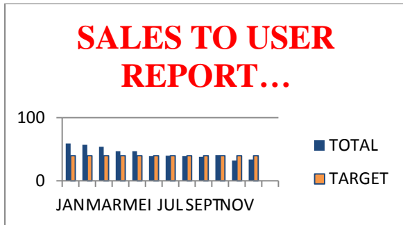
Diagram 1.1 Data Penjualan CV. Sumber Baru Motor Dongkelan Tahun 2016

NMAX terbanyak sebagaimana data penjualan terakhir berikut: