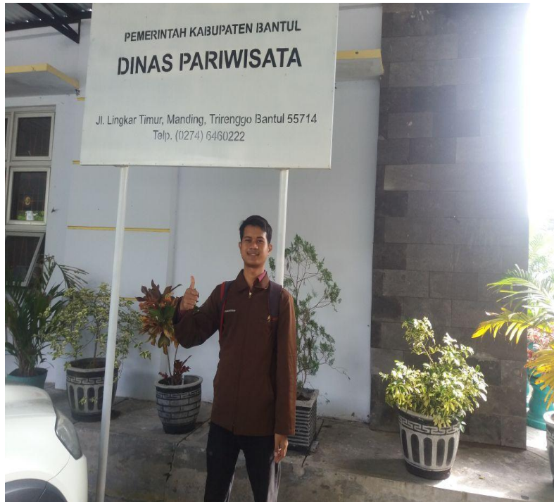
Selesai Kunjungan Wawancara ke PEMDA Bantul