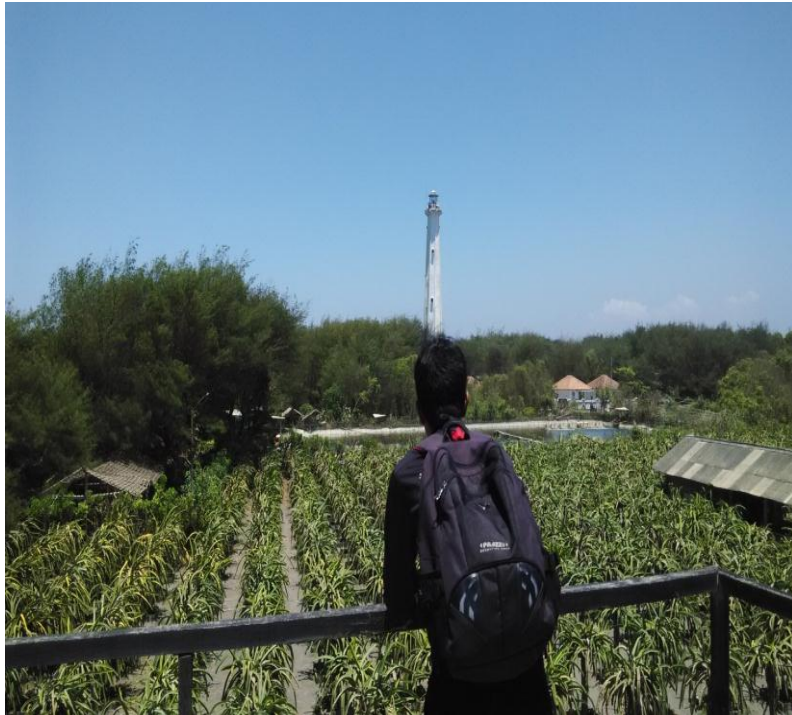
Kebun Buah Naga