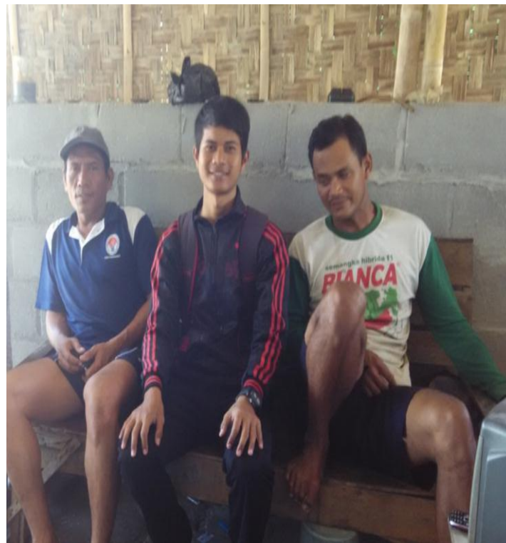
Wawancara : Petani Tambak Udang