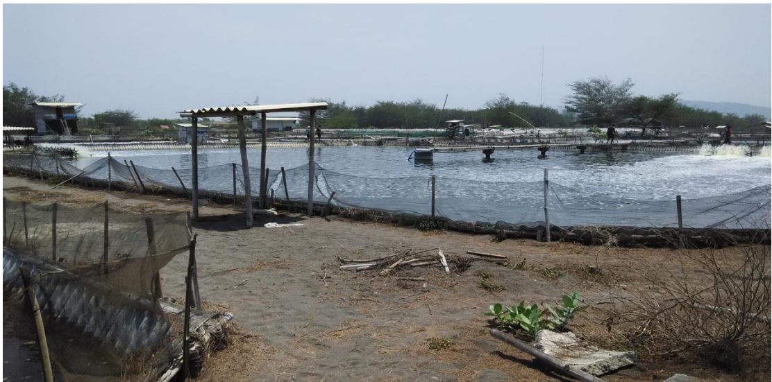
Tambak udang diwilayah Pantai Pandasari