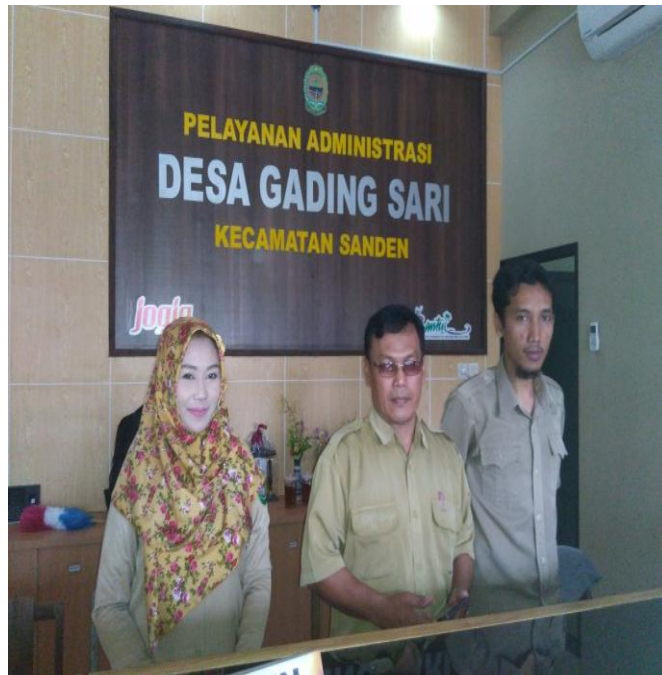
Perangkat Desa Gadingsari