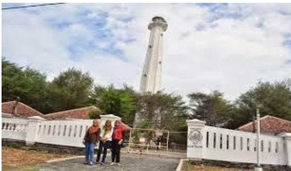
Mercusuar Pantai Pandansari