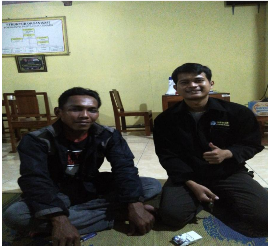
Wawancara : Anggota Pengelola Pantai