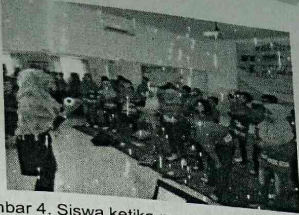
Gambar 4. Siswa ketika menyanyikan lagu Angry