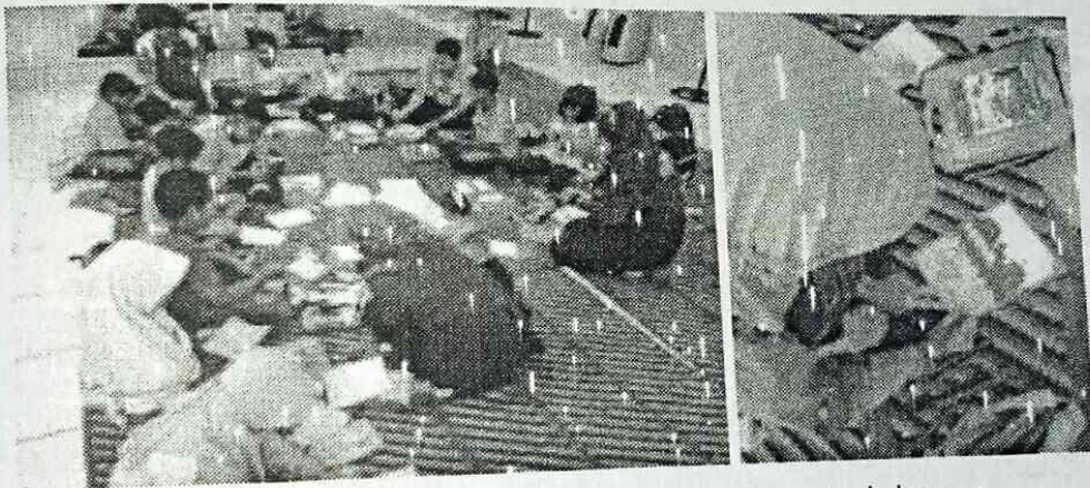
Gambar 5. Siswa ketika membuat kartu lebaran

Mereka menggunakan kata-kata, frase, dan ekspresi-ekspresi yang sudah dipelajari untuk membuat tulisan sederhana dalam bentuk kartu. Setelah mereka marah dan menunjukkan rasa marah mereka kepada keluarga atau teman, apa yang mereka lakukan setelah itu. Mereka menjawab merasa tidak enak atau merasa bersalah. Untuk itulah, mereka membuat kartu lebaran yang berisi permintaan maaf kepada orang terdekat mereka dengan tema laut dan ikan paus.