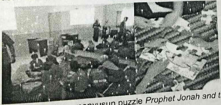
Gambar 1. Siswa sedang menyusun puzzle Prophet Jonah and the Whale

Sebelum masuk ke kegiatan inti, siswa diperkenalkan dengan tema yang akan dibahas. Pada tahap ini, teknik pengajaran deduktif dimana siswa menyimpulkan sendiri apa yang mereka pelajari setelah melakukan suatu kegiatan pun diaplikasikan. Pada langkah ini, semua siswa kelas lima dan enam dibagi menjadi kelompok-kelompok kecil yang beranggotakan lima sampai tujuh orang. Kemudian mereka berlomba untuk menyusun puzzle menjadi sebuah gambar utuh. Tiga kelompok pertama yang berhasil menyelesaikan puzzle mendapatkan sticker dari narasumber. Setelah semua kelompok berhasil menyusun gambar, dengan bimbingan dari narasumber, siswa diarahkan untuk menghubungkan gambar dengan tema cerita yang hendak dibawakan oleh narasumber.