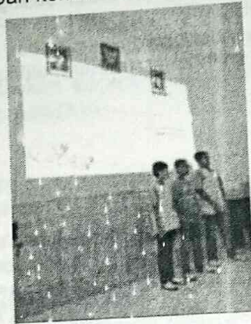
Gambar 3. Siswa ketika menceritakan kembali kisah Prophet Jonah and the Whale