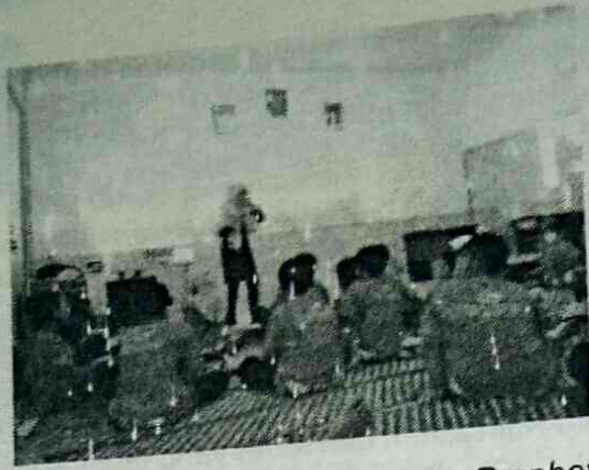
Gambar 2. Siswa pada saat mendengarkan cerita Prophet Jonah and the Whale Practice Setelah menerima bekal berupa input bahasa yang cukup pada tahap Presentation , siswa menceritakan kembali kisah berjudul Prophet Jonah and the Whale dengan bahasa mereka sendiri di depan teman-teman satu kelas mereka. Setiap kelompok berdiskusi dan memilih anggota yang akan bercerita di depan kelas.