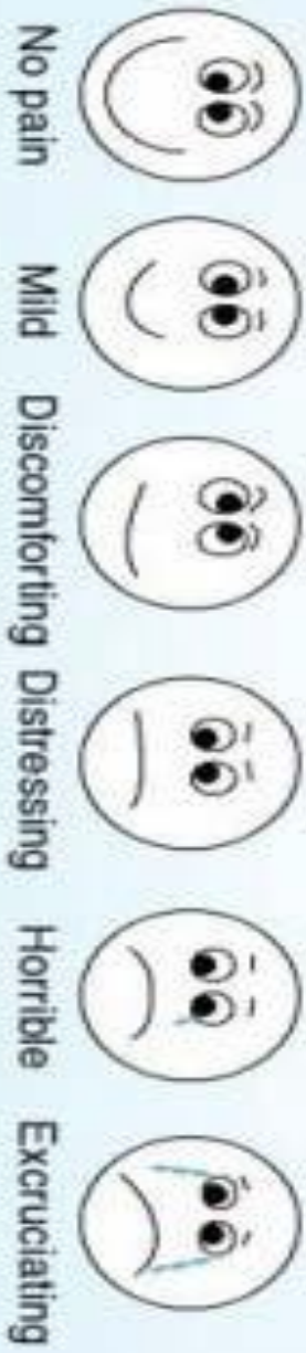
Alat ukur penelitian (Visual Analogue Scale)