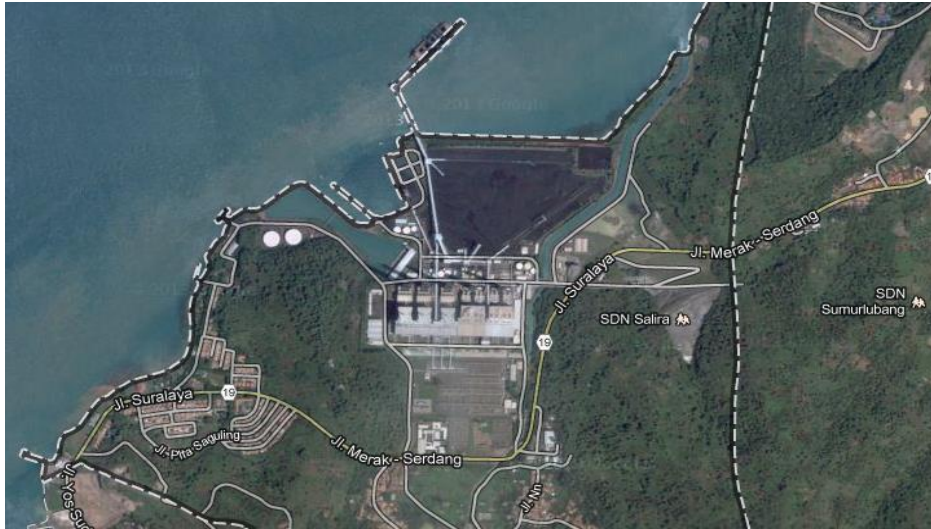
Gambar 3.1 Peta Lokasi PLTU Suralaya