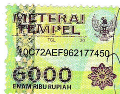
Fiqi Nur Aeni Afnan