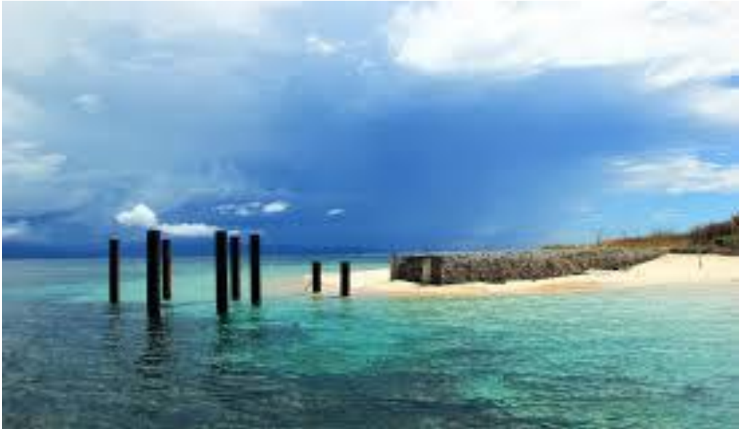
Gambar 9 : Gili Bidara