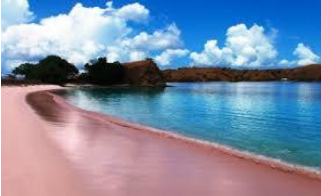
Gambar 1 : Pantai Pink