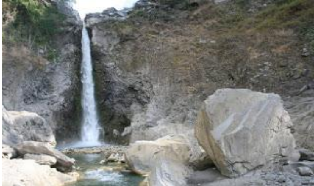
Gambar 17 : Air Terjun Mayung putek