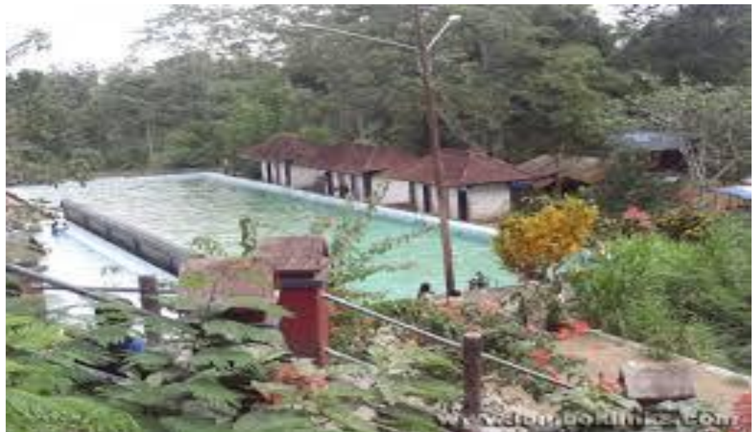
Gambar 16 : Otak kokok joben