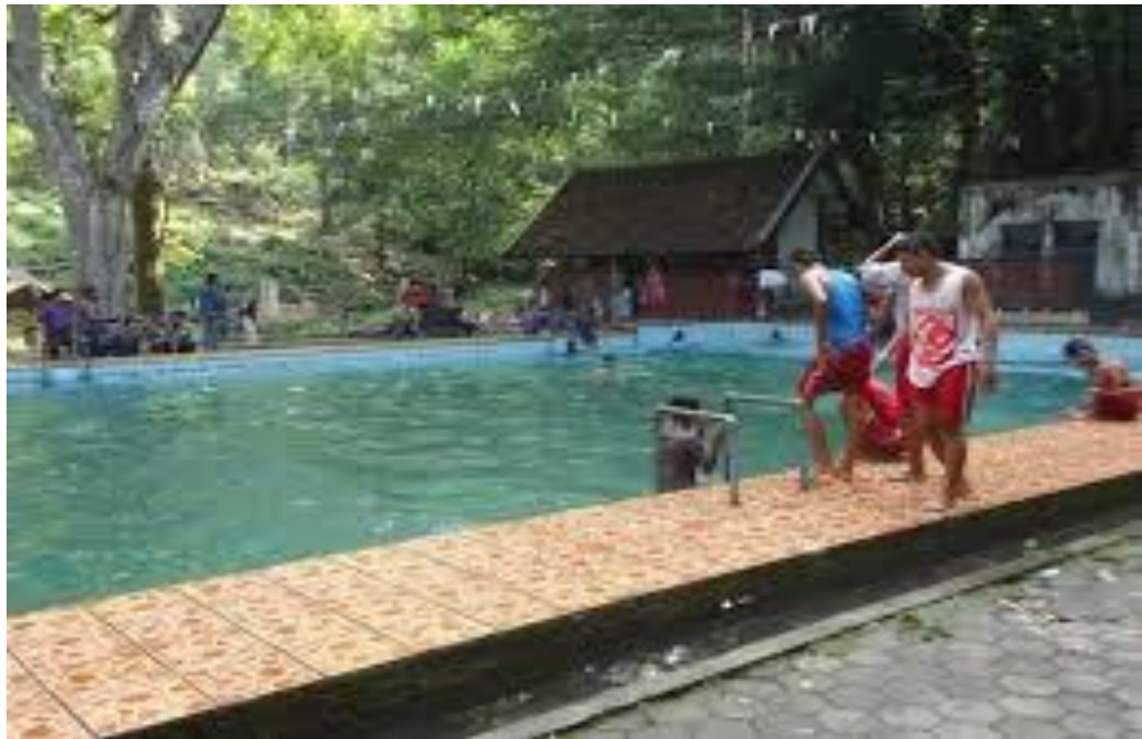
Gambar 18 : Pemandian Lemor