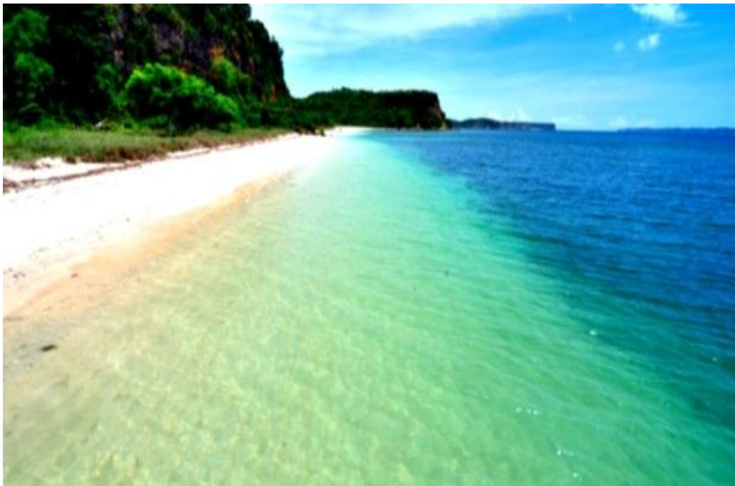
Gambar 8 : Pantai Ekas