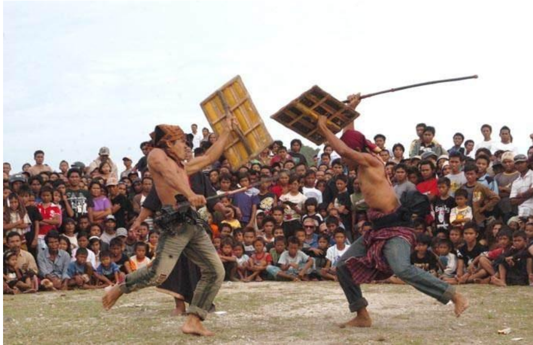
Gambar 21 : Presean