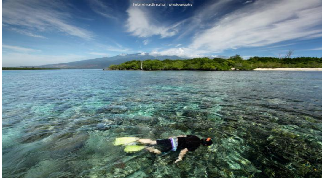
Gambar 11 : Gili Sulat