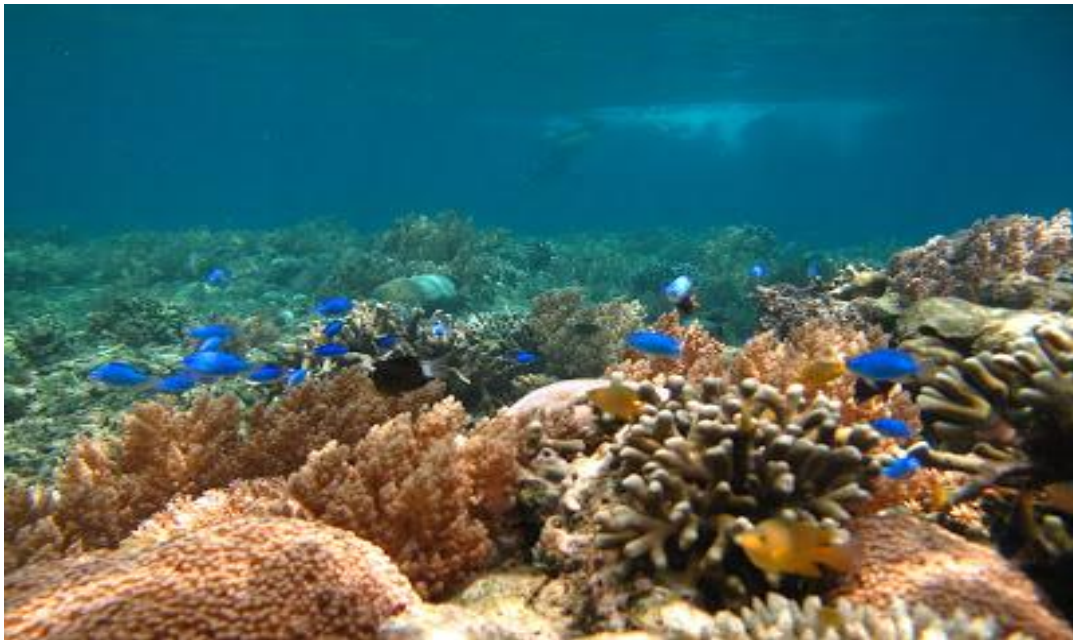
Gambar 12 : Gili lawang