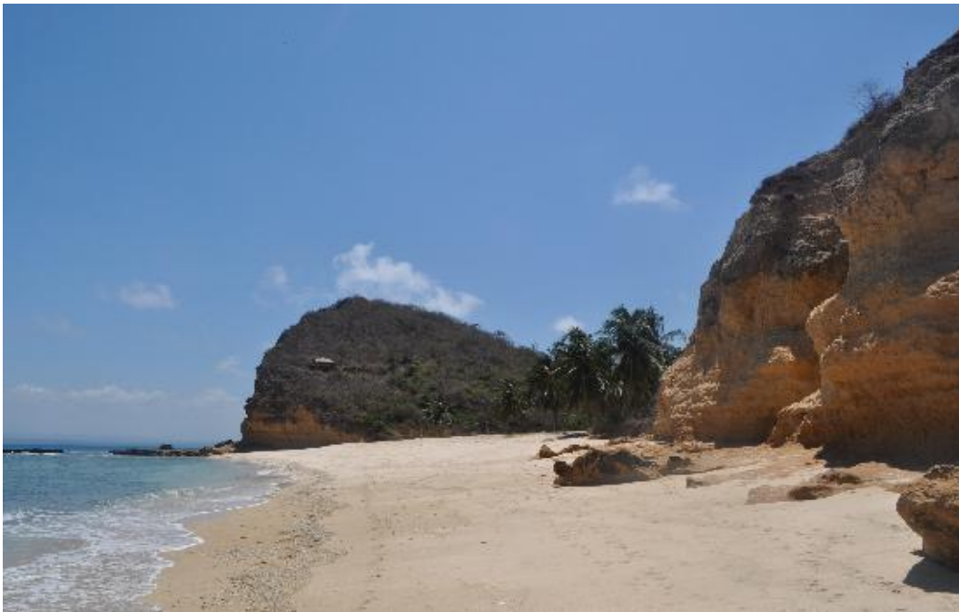
Gambar 6 : Pantai Sorga