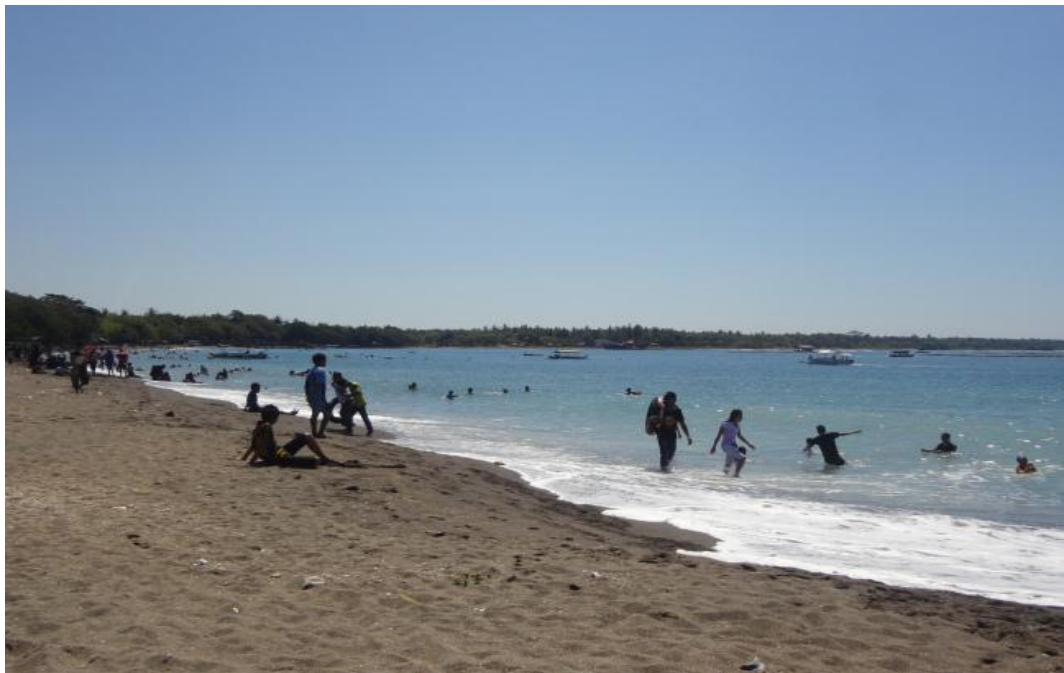
Gambar 10 : Gili lampu