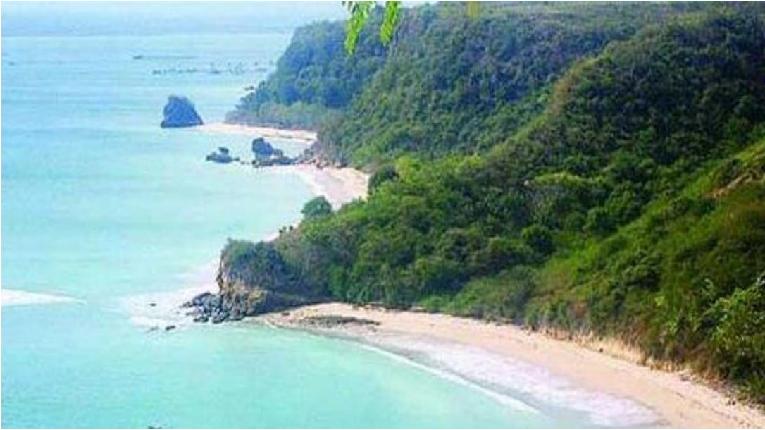
Gambar 7 : Pantai Cemara