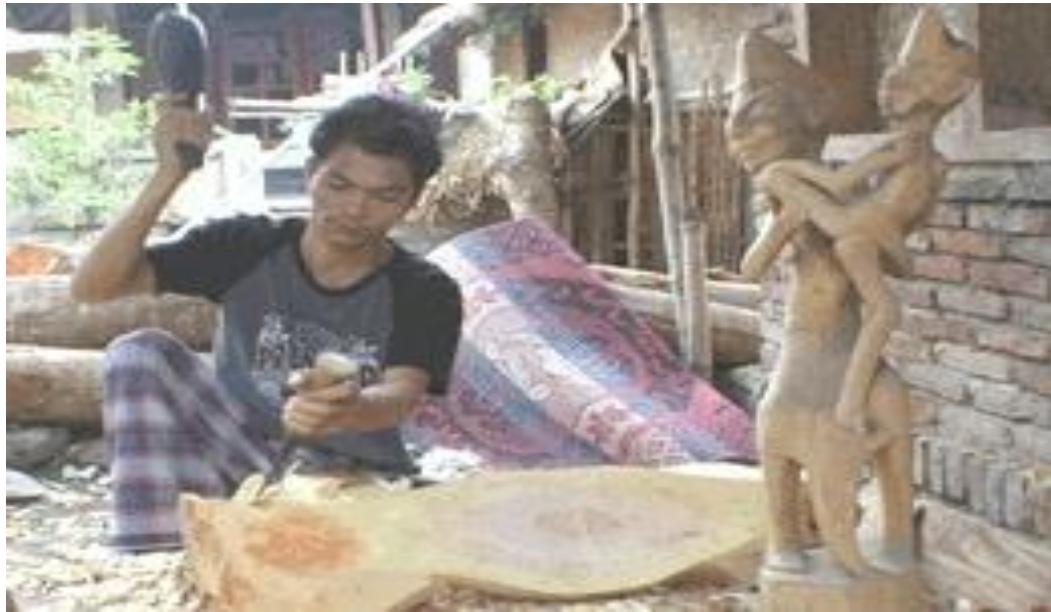
Gambar 25 : Kerajinan Patung Senanti