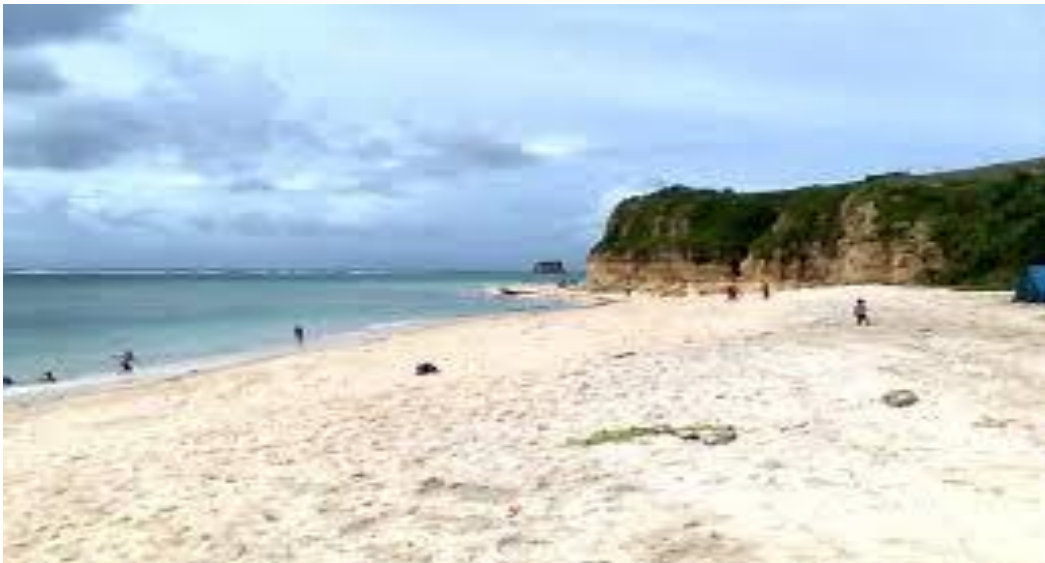
Gambar 2 : Kaliantan