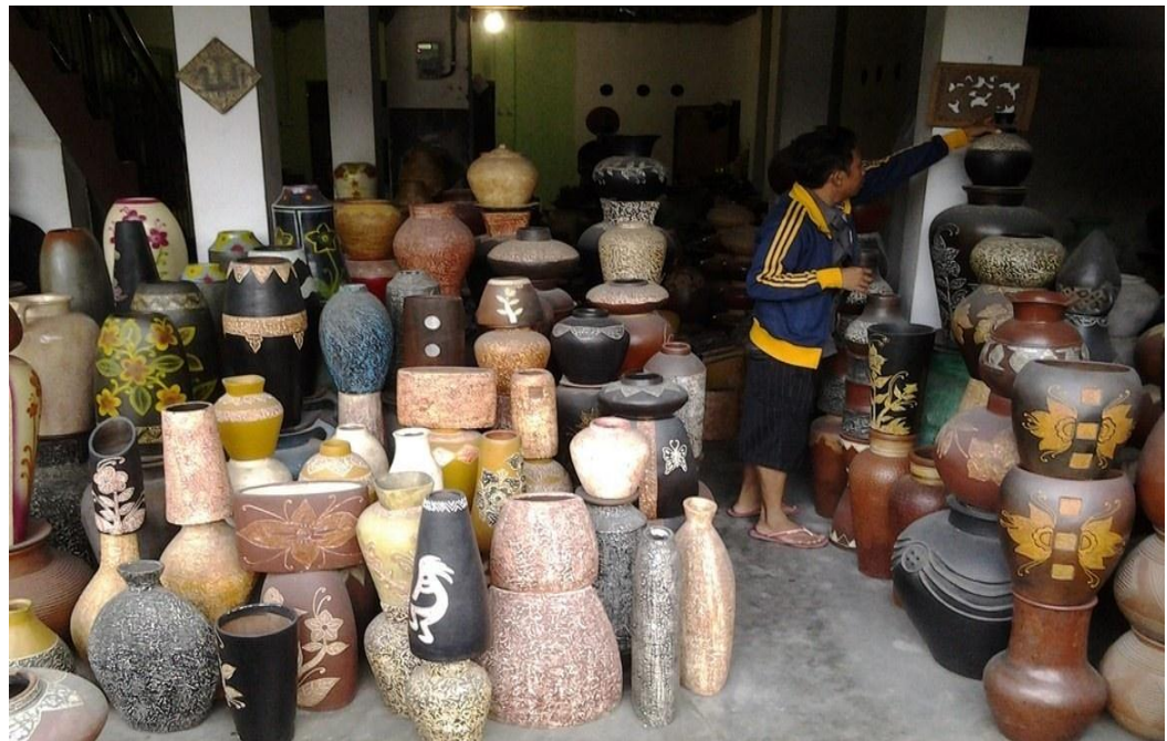
Gambar 24 : Kerajinan Gerabah