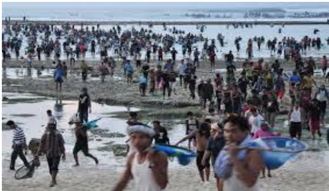
Gambar 20 : Bau nyale