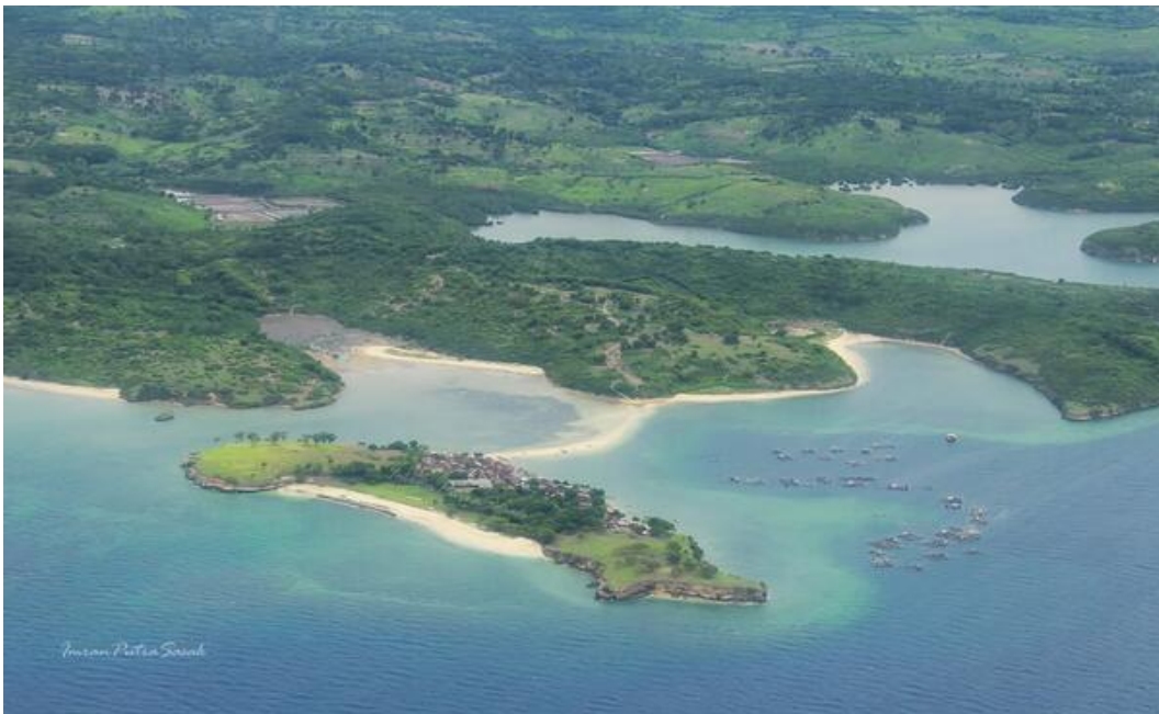
Gambar 4: Gili Sunut