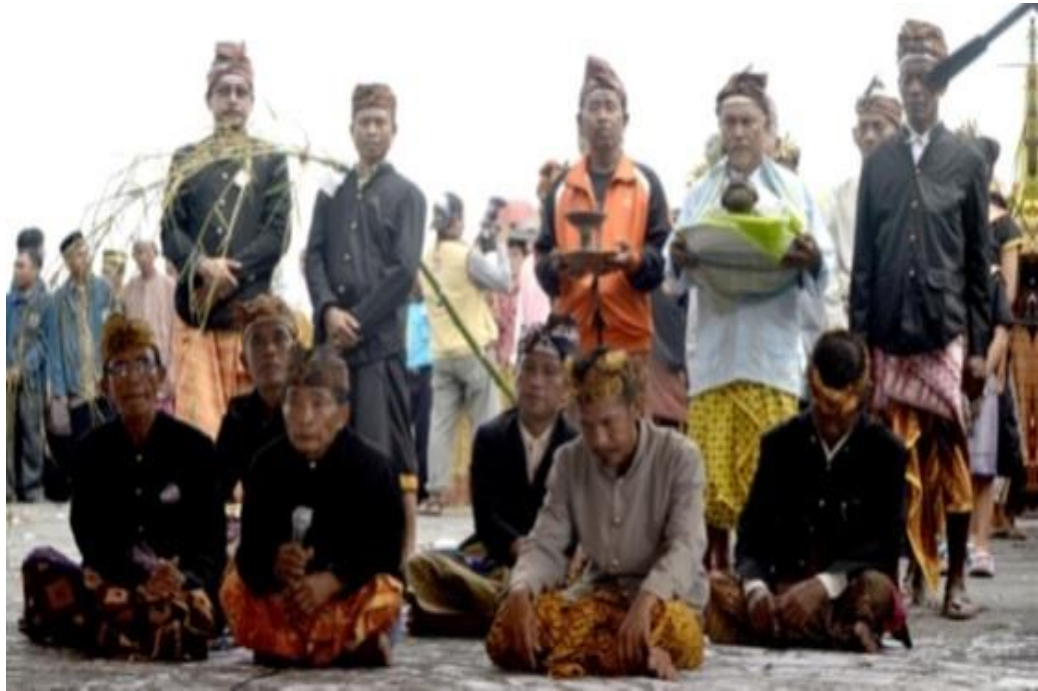
Gambar 19 : Upacara Rebo Bontong