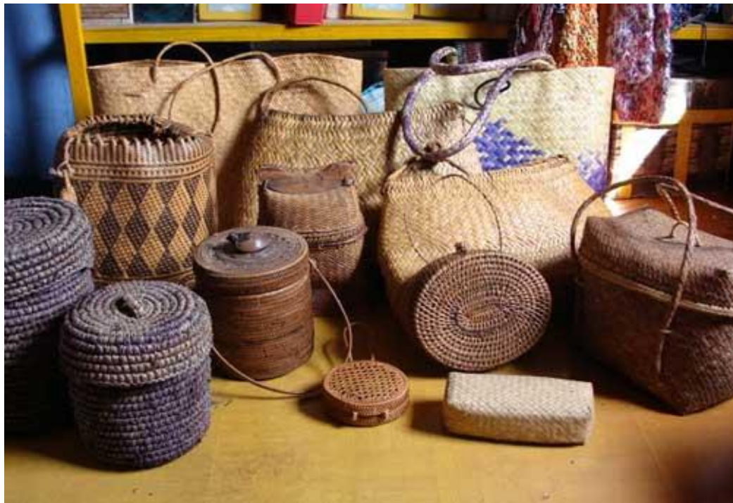
Gambar 26 : Anyaman Bambu Loyok