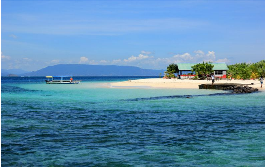
Gambar 5 : Gili Kondo