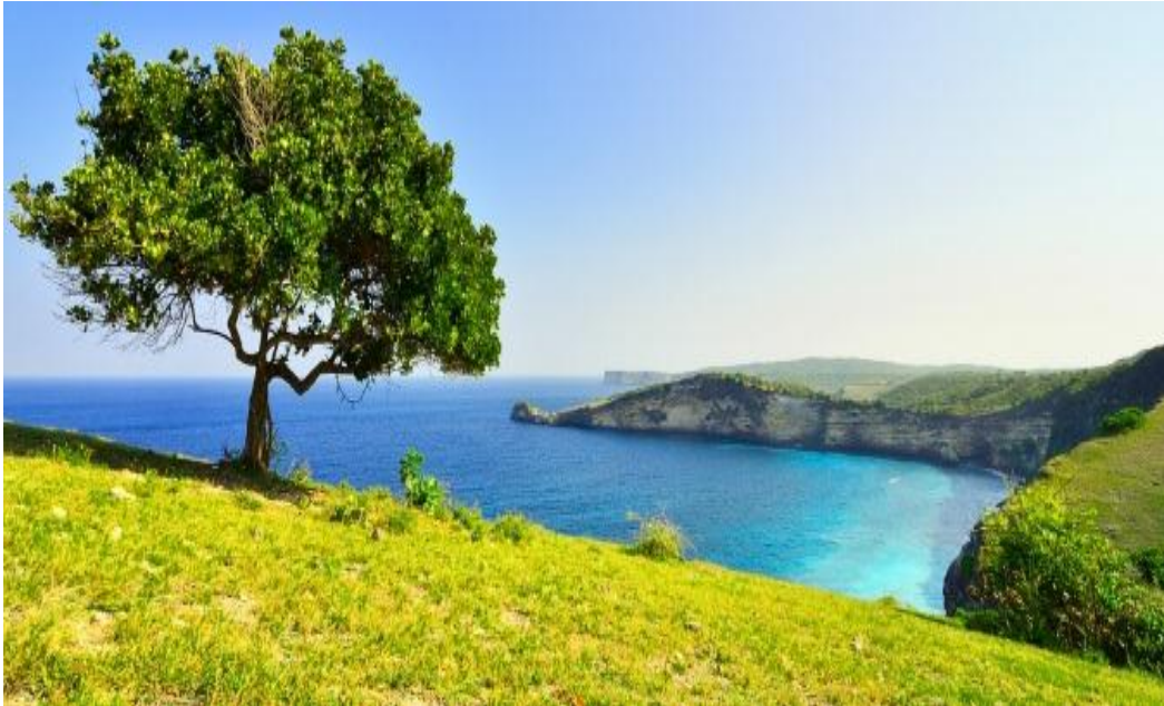
Gambar 3 : Tanjung ringgit