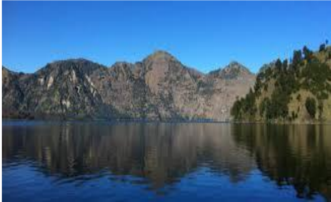
Gambar 15 : Danau Segara anak