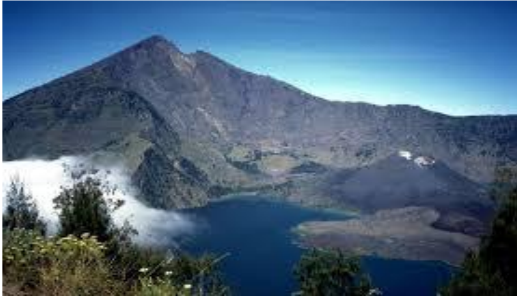
Gambar 13 : Gunung Rinjani