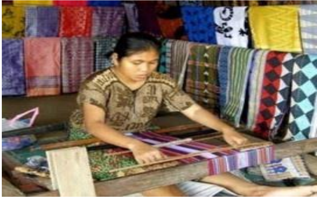
Gambar 23: Kerajiana Tenun Gedogan