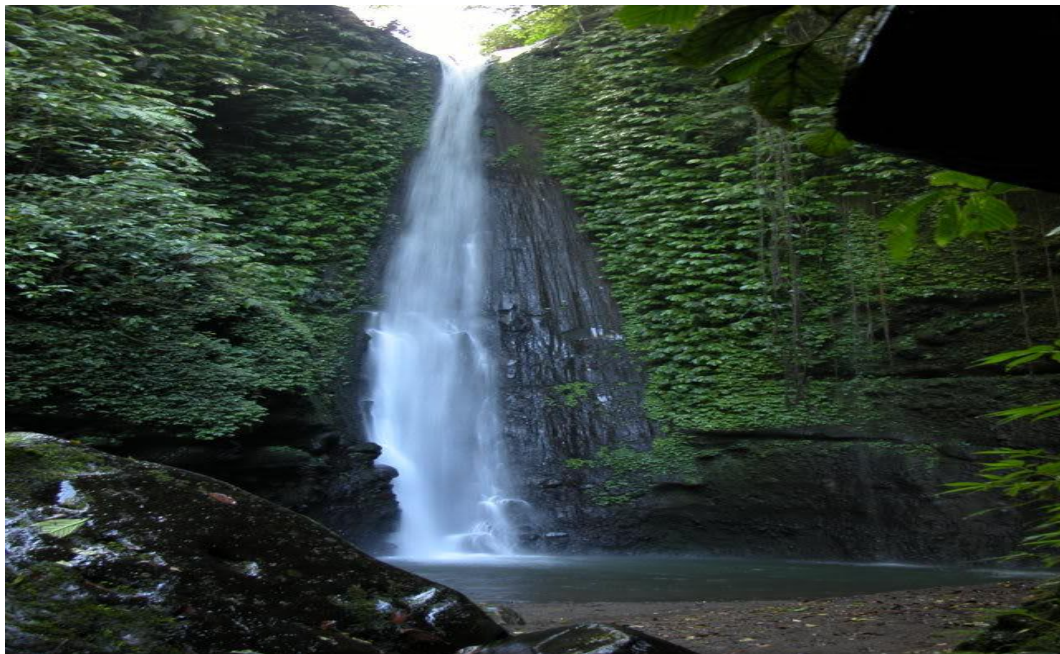
Gambar 14 : Air Terjun Jeruk manis