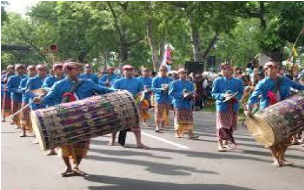
Gambar 22 : Gendang Belek