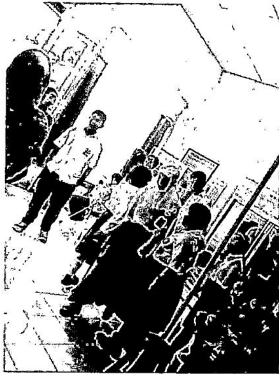
Gambar Anak-anak SLB-C Dharma Rena Ring Putra II