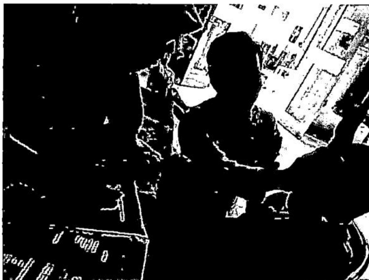
Gambar Pemeriksaan OHI