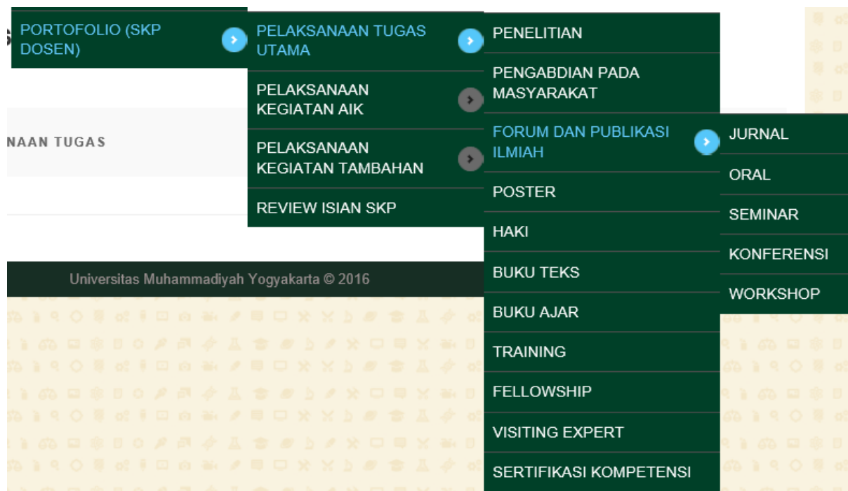
Gambar 1. Bagan Pelaksanaan Tugas Utama Seorang Dosen

Pada periode SKP tahun ini, ada beberapa perubahan tatacara mengunggah dokumen pendukung SKP. Pada awal prosesnya, dokumen pendukung tersebut harus dipisah-pisahkan menjadi beberapa bagian, karena adanya keterbatasan ruang penyimpanan aplikasi SKP. Cara ini dinilai kurang praktis, sehingga pada proses pengunggahan dokumen pada saat ini dilakukan oleh dosen melalui Repo UMY. Fasilitas ini memungkinkan para dosen untuk mengunggah file lengkap ( fulltext ) hasil karya ilmiah, buku maupun dokumen-dokumen penelitian dan pengabdian masyarakat.