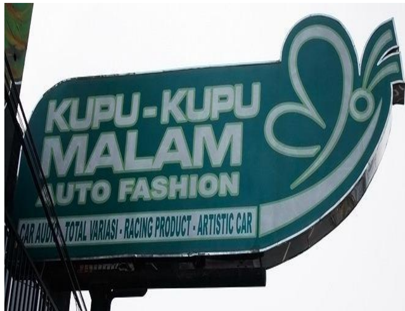
Promosi Kupu-Kupu Malam Dalam Bentuk Baliho