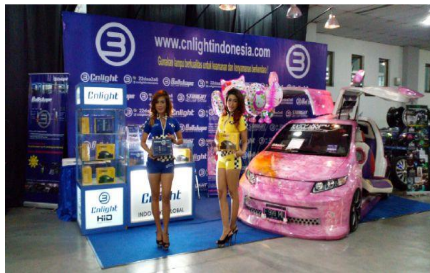
Pemasaran Langsung Kupu-Kupu Malam

Jenis pemasaran interaktif ini menjadi penting karena, beberapa konsumen dapat mengetahui Kupu-Kupu Malam secara detail dan menyeluruh tanpa harus datang ke perusahaan secara langsung. Hal ini