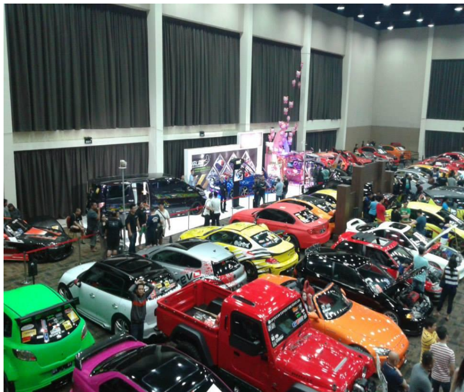
Strategi Promosi Kupu-Kupu Malam Melalui Even