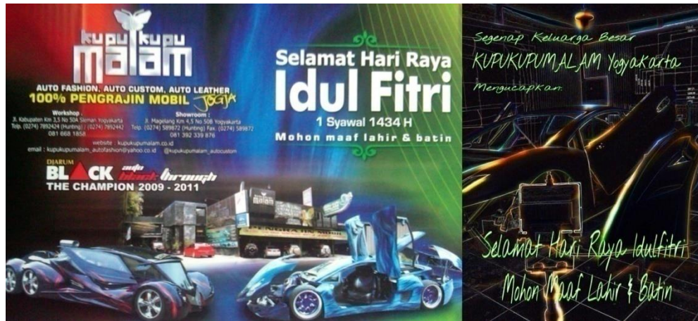
Iklan Kupu-Kupu Malam Dalam Bentuk Spanduk