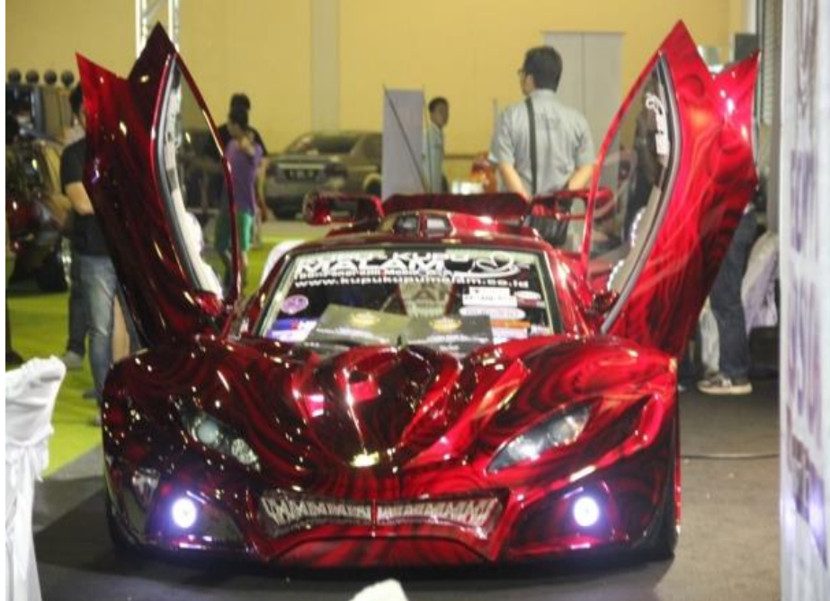
Hasil Modifikasi Kupu-Kupu Malam