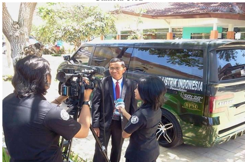
Publisitas Kupu-Kupu Malam Melalui Media Televisi