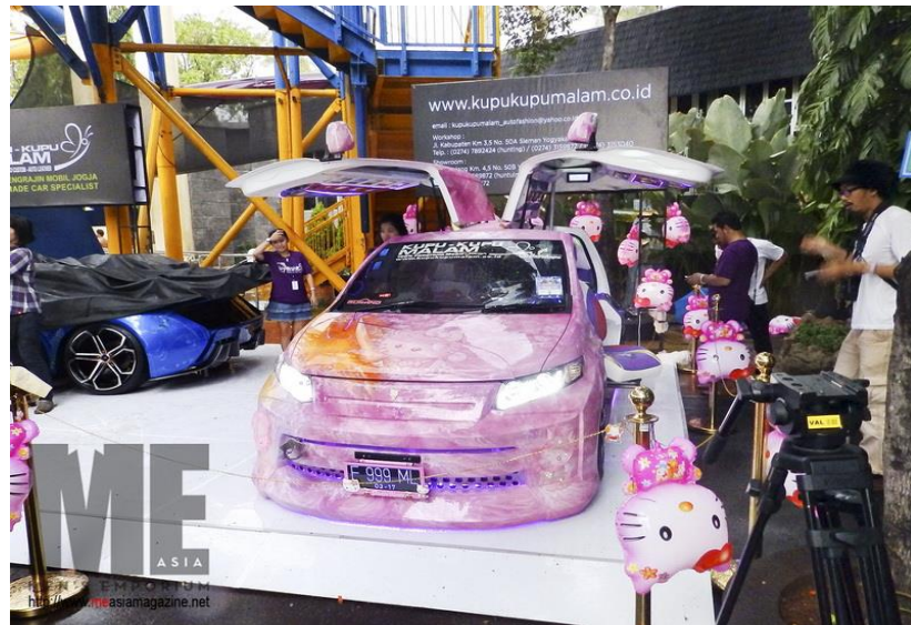
Strategi Promosi Kupu-Kupu Malam Melalui Even

Berikut adalah strategi promosi yang dilakukan “Kupu-Kupu Malam” dalam meningkatkan jumlah pelanggan pada tahun 2014, sebagai berikut: