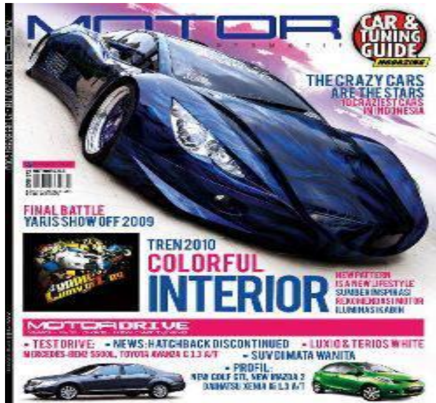
Promosi Kupu-Kupu Malam Dalam Bentuk Majalah