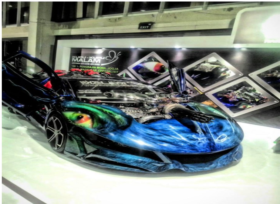
Hasil Modifikasi Kupu-Kupu Malam