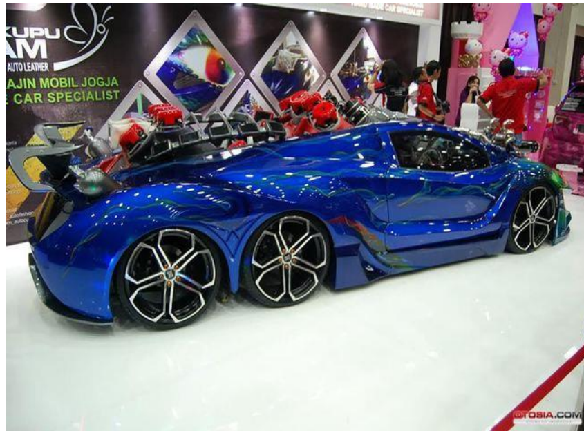
Hasil Modifikasi Kupu-Kupu Malam