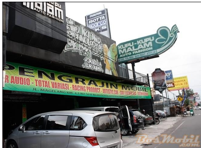
Promosi Kupu-Kupu Malam Dalam Bentuk Spanduk