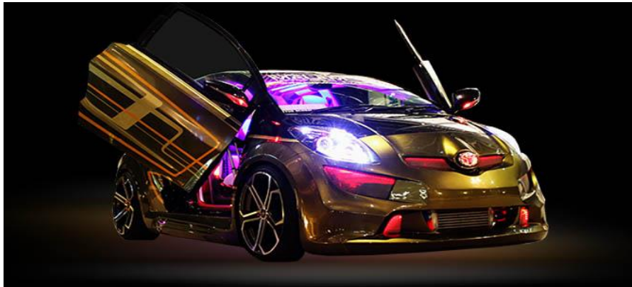
Yaris Kupu-Kupu Malam

Yaris Kupu-Kupu Malam adalah mobil Honda Yaris yang dimodifikasi oleh Kupu-Kupu Malam yang di nobatkan sebagai The King Of Yaris Show Off 2014 dinominasikan untuk The Best Interior, The Best Audio Cosmetic dan The Best Body Kit .