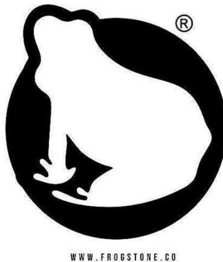
Gambar 1.2. Logo FROGSTONE

FROGSTONE merupakan perusahaan yang bergerak di bidang jasa pembuatan T-Shirt, dan asecories. Nama Frogstone berasal dari kata 'Frogs tone' artinya suara katak yang banyak dan bersautan. Hal ini terinspirasi dari suara katak ketika nongkrong malam-malam di pematang sawah. "Kung kong kung kong, begitu bunyinya.