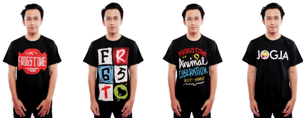
Gambar 1.5. Desain Kaos Produk Frogstone