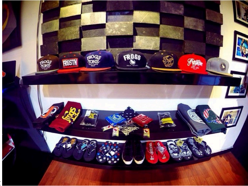
Gambar 1.5. Produk Frogstone

Inilah beberapa produk Frogstone Cloting Jogja