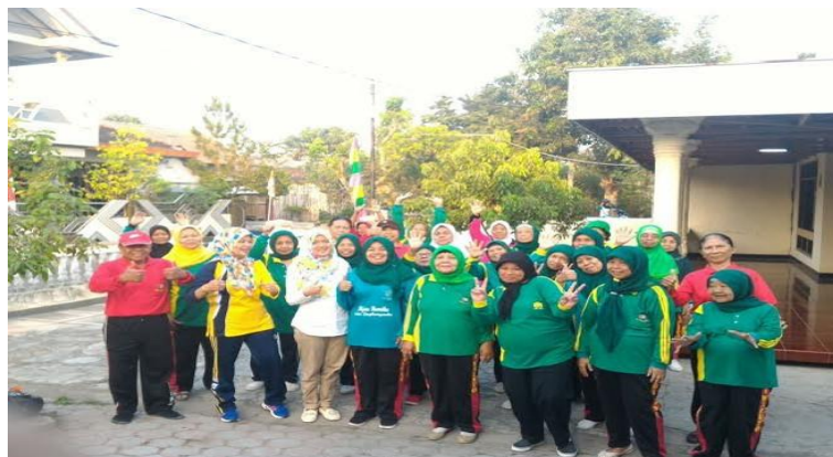
Pasca intervensi ROM