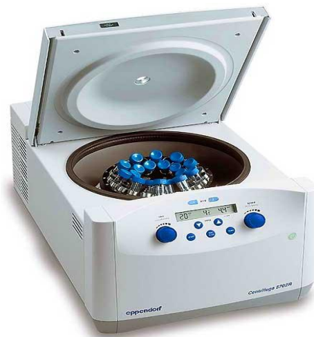
Gambar II. Alat Sentrifugasi