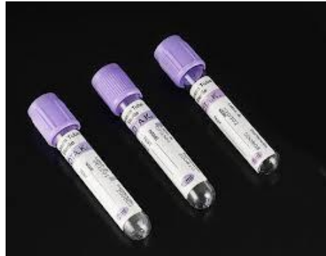
Gambar III b. Tabung Vacutainer