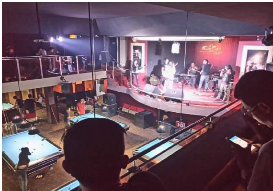
Gambar 1.6 Tempat Duduk Unik di Atas Seperti Balkon