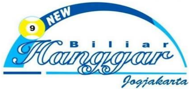
Gambar 1.2 Logo New Hanaggar