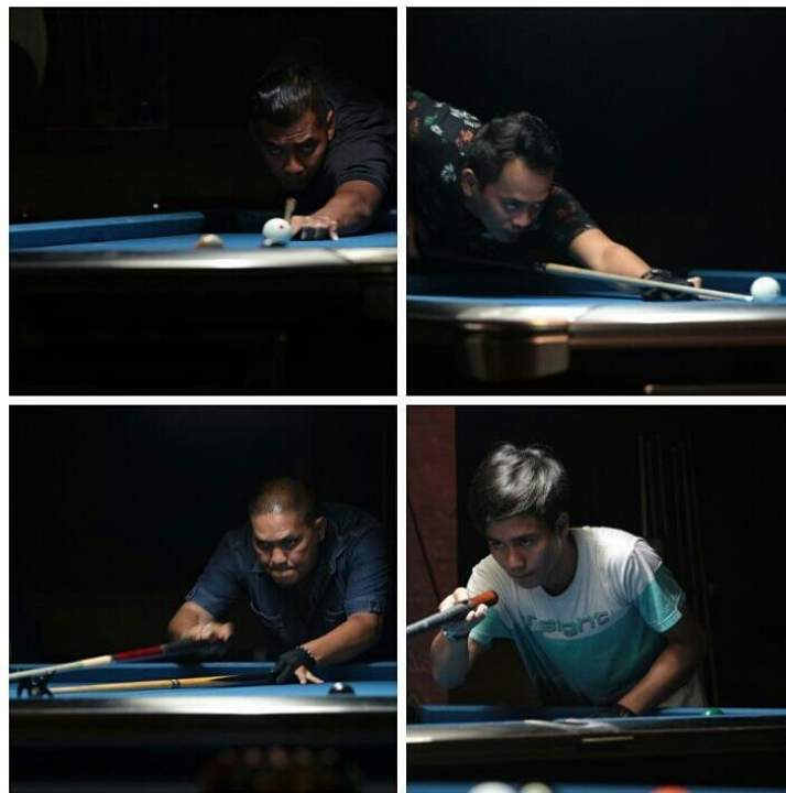
Gambar 1.8 Foto pertandingan turnamen