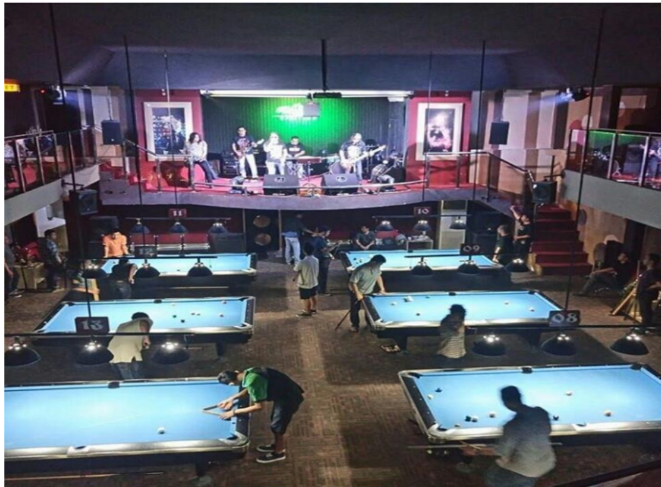
Gambar 1.11 Foto Live Music