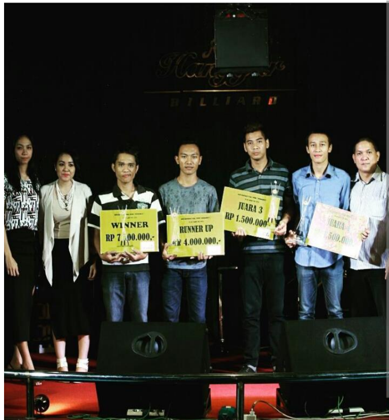
Gambar 1.10 Foto Pemenang Turnamen