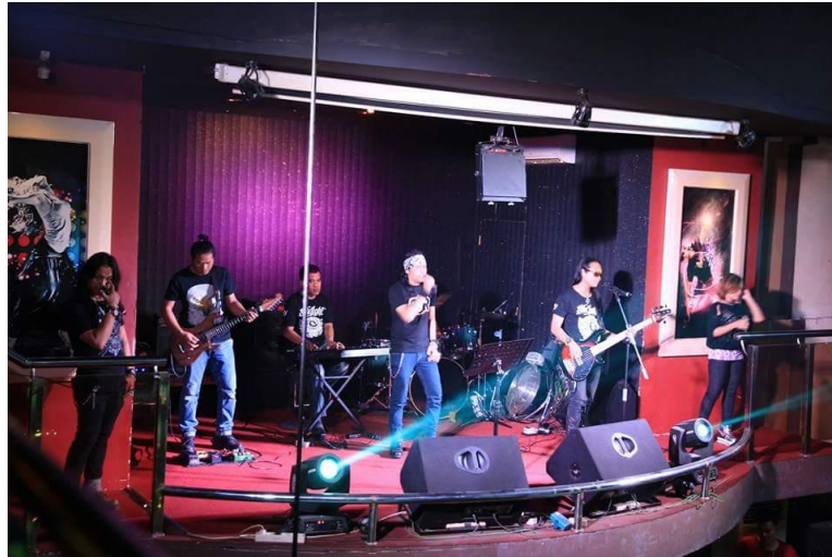
Gambar 1.7 Panggung Live Music

Nama Perusahaan : PT. Cipta Hanggar Kreasi Status Perusahaan : Perseroan Terbatas Cabang Perusahaan : Hanggar Biliar Yogyakarta Tanggal Berdiri : 10 juli 2004 Alamat : JL. Sewandanan No. 1 Komplek Puro Pakualaman, Pakualaman, Yogyakarta Bidang usaha : Hiburan Total karyawan : 37 orang Contact peson : ( 0274 ) 512193 Facebook : New Hanggar Biliar Jogja, Rama Billiar Yogyakarta Google+ : New Hanggar Biliar Jogja Intagram : ramabiliar Twitter : @hanggarcrew