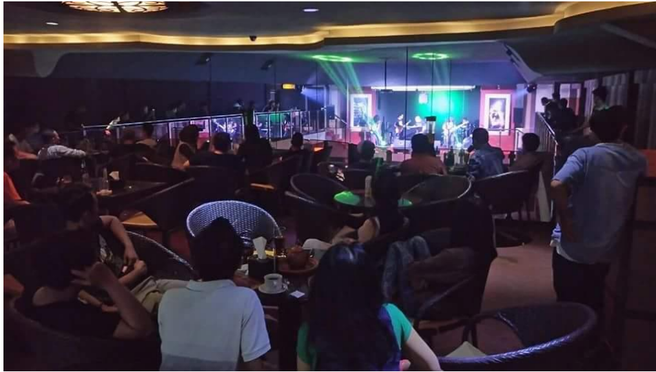
Gambar 1.5 Lounge Balkon dan Lounge di Dalam