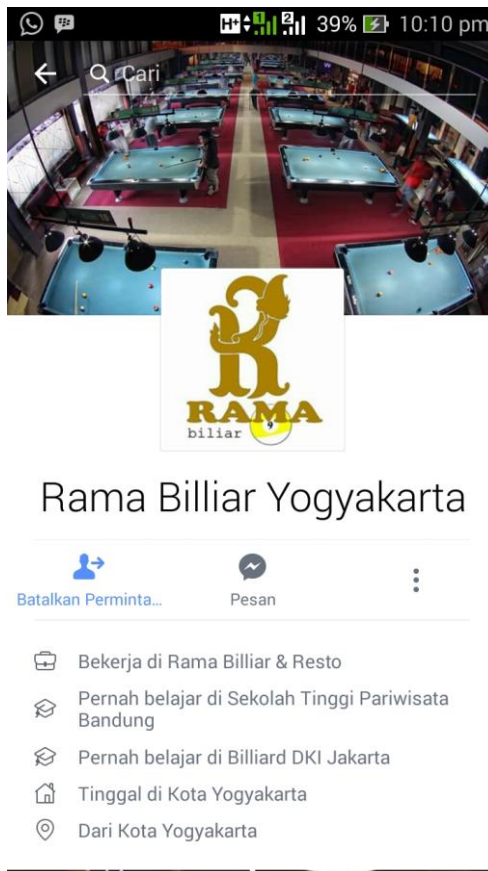
Gambar 1.4 Facebook Rama Biliar