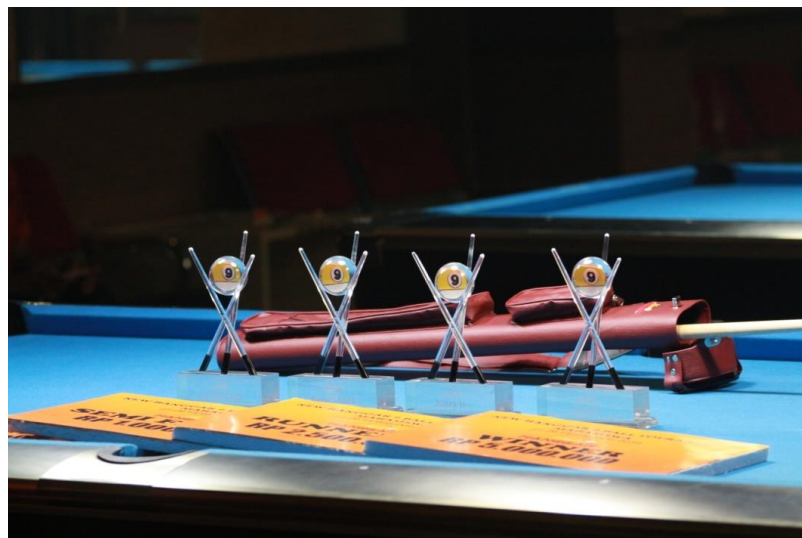
Gambar 1.9 Foto Piala New Hanggar