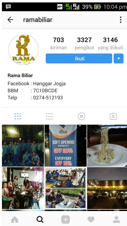
Gambar 1.3 Instagram Rama Biliar