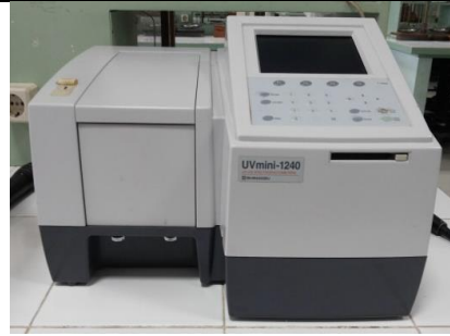
Spektrofotometer (Shimadzu, Australia)