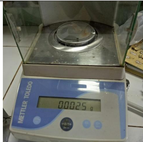
Penimbangan Ekstrak Etanol Propolis