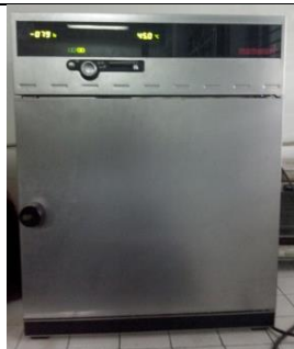
Inkubator CO 2