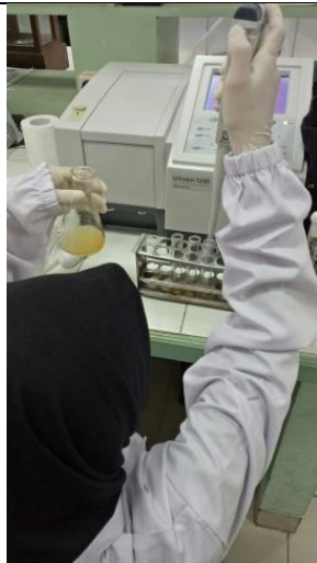
Proses Penambahan Suspensi Bakteri pada Media