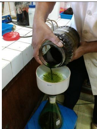
Proses Penyaringan E