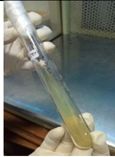
Bakteri Porphyromonas gingivalis ATCC 33277