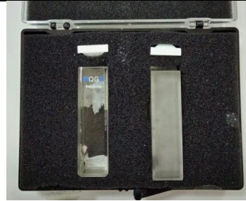
Kuvet Kuarsa (Hellma, Germany)