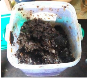
Propolis Apis Trigona