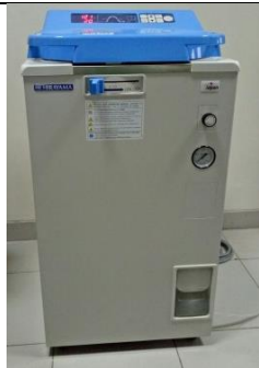
Autoklaf (Hirayama, Japan)