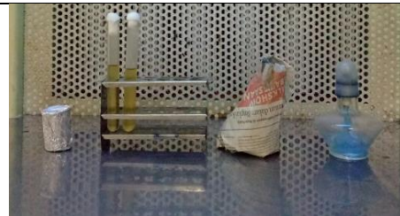
(dari kiri ke kanan) Gelas Beaker, Rak Tabung, Tabung Reaksi, Tryptose Phosphate Broth , Tabung Erlenmeyer, Lampu Spiritus