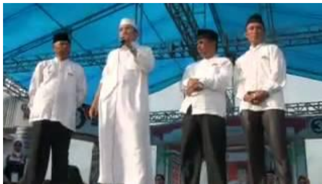
Gambar 4 Kegiatan Kampanye TGB-Amin Bersama Bupati Lombok Timur