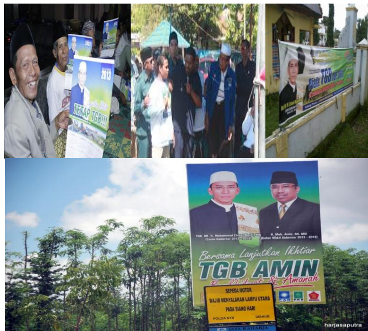
Gambar 9 Beberapa alat-praga kampanye TGB-Amin

Pada implementasinya penempatan dan pemasangan media atau alat-praga kampanye yang dilakukan tim, tentu akan berpengaruh pada tokoh-tokoh masyarakat yang menjadi panutan di masyarakat itu sendiri, efektifnya suatu penempatan alat-praga kampanye kemudian akan menjadi pertimbangan pemilih sehingga akan menghasilkan target yang memuaskan juga.