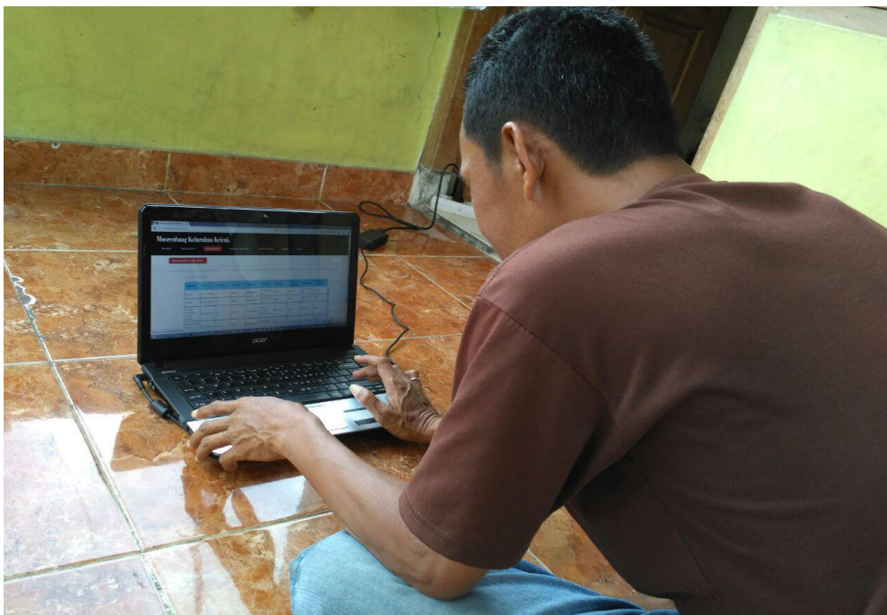
Lampiran User Sedang Menjalankan aplikasi