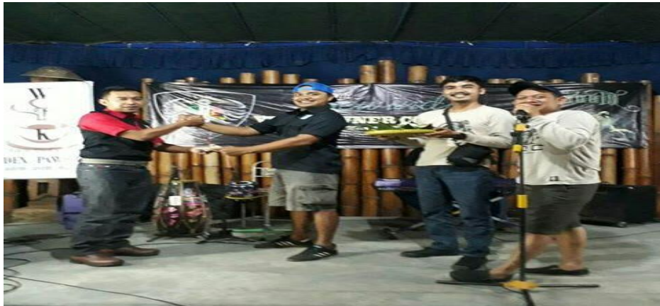
Gambar 2.8 Ulang tahun Sewindu distrik Voc