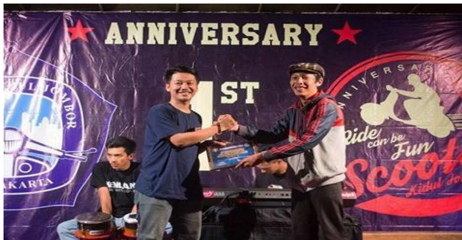
Gambar 2.6 Menghadiri Anniversary dari komunitas Scooter Kidul Jombor.