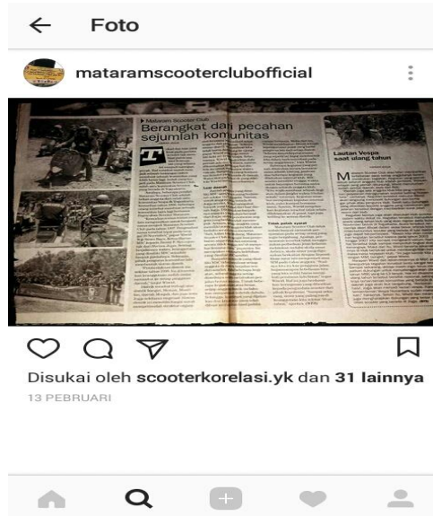
Gambar 2.4 Profil Mataram Scooter Club dalam media cetak