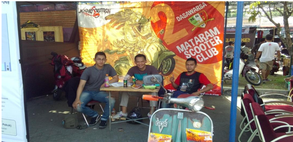
Gambar 2.9 Peneliti ikut menjaga tenda dari MSC di even Parjo Jogja 29 Oktober 2017