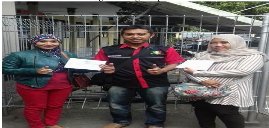
Gambar 2.7 Ketua Umum MSC berfoto bersama setelah menyelesaikan program SIM masal gelombang delapan.