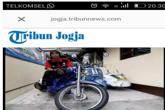
Gambar 2.5 Kegiatan Sosial Mataram Scooter Club