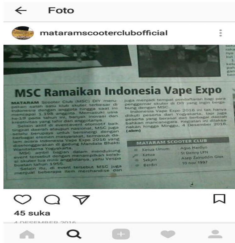
Gambar 2.3 Ikut memeriahkan acara Indonesia Vape Expo Tahun 2016