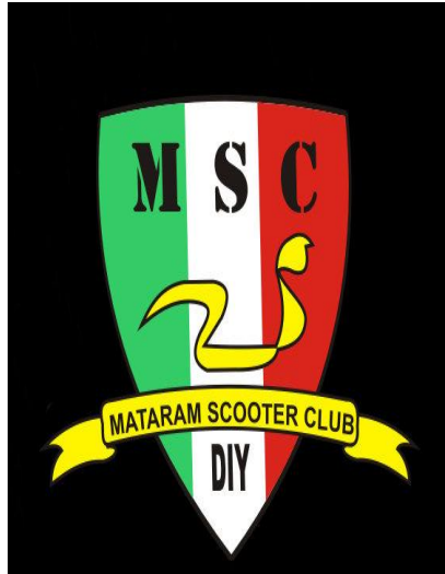
Gambar 2.1 Logo Komunitas Mataram Scooter Club