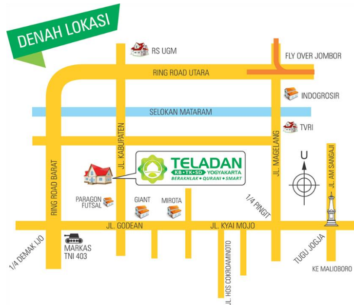
Gambar 1. 3 Foto Denah Lokasi Sekolah Teladan Yogyakarta