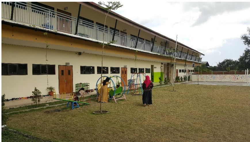
Gambar 1. 2 Foto Sekolah Teladan Yogyakarta