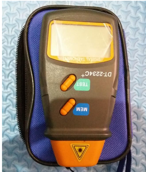
Gambar alat pembeding ( Tachometer )