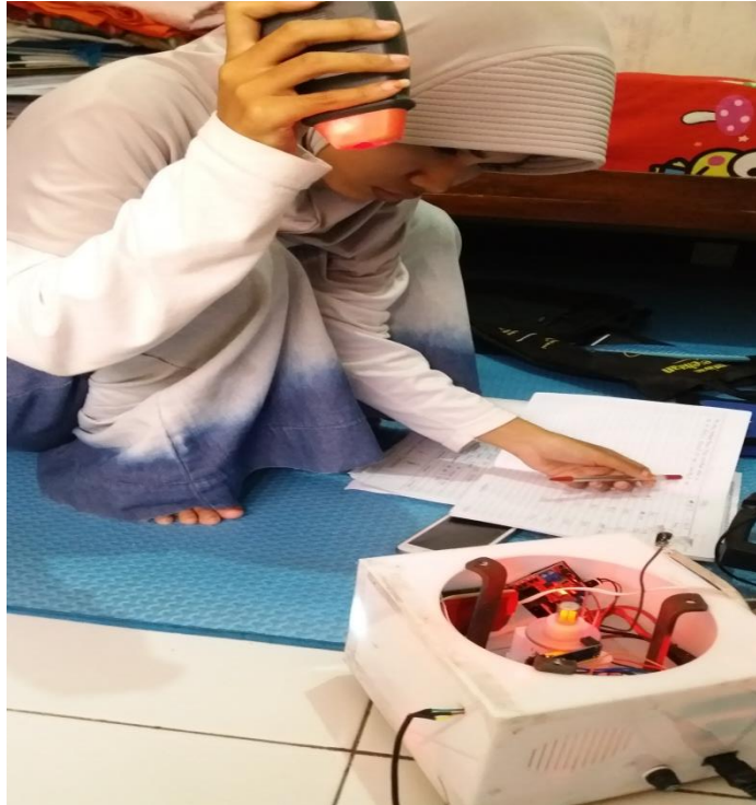
Pengambilan data pada kecepatan motor menggunakan alat kalibrator tachometer