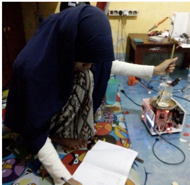
Pengambilan data pada suhu menggunakan alat kalibrator thermometer