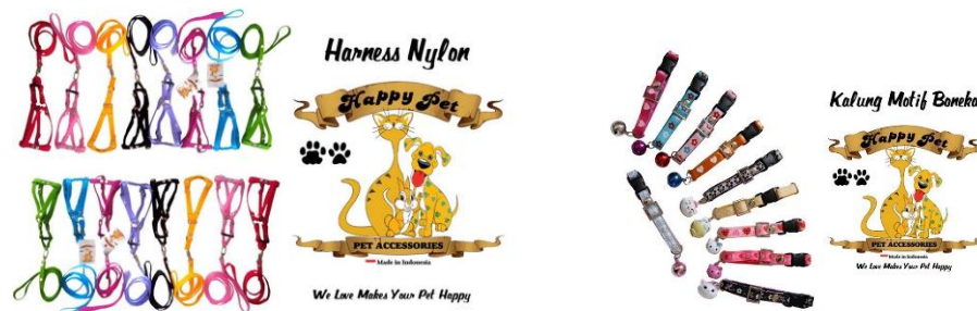
Gambar 2.2 (Contoh Produk Kesehatan My Happy Pets)

Sekarang ini, muncul fenomena baru dimana para pemilik hewan menginginkan piaraannya tampil modis seperti sang pemiliknya. Mereka memakaikan kalung, harness , mainan hingga menyediakan rumah khusus bagi piaraan tersebut. My Happy Pets menganggap ini sebuah peluang untuk bisnis mereka untuk membuat Accessories Pet Product untuk hewan peliharaan. Dibawah ini merupakan contoh produk aksesoris My Happy Pets: