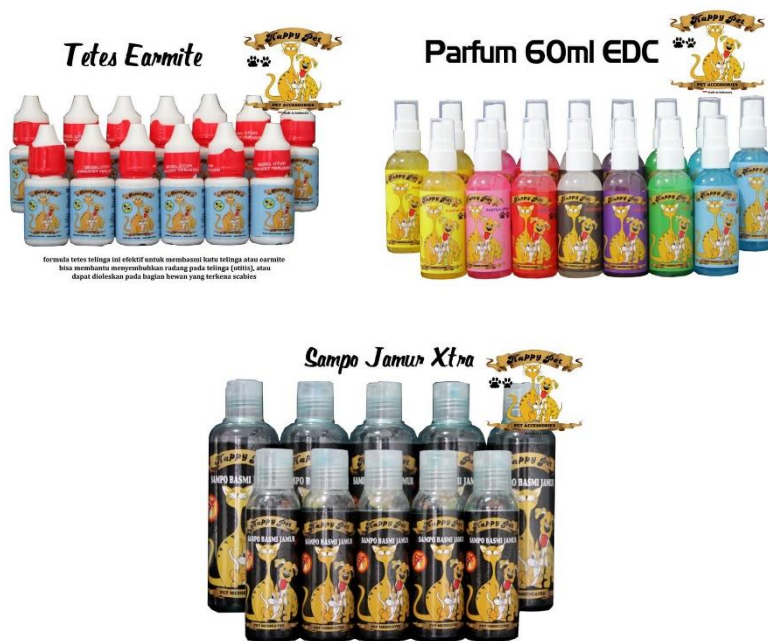
Gambar 2.1 (Contoh Produk Kesehatan My Happy Pets)