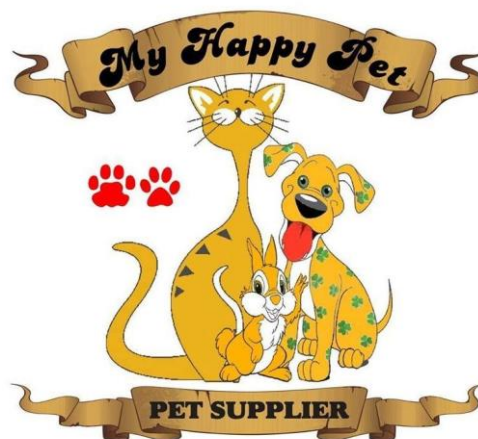
Gambar 2.3 (Logo My Happy Pets)