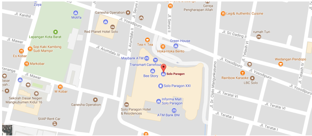
Gambar 2.4 Peta Lokasi Solo Paragon Mall