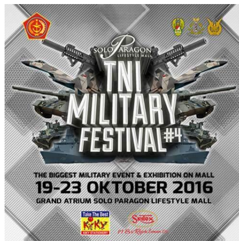
Gambar 2.5 Poster TNI Military Festival

ini juga tidak dipungut biaya sedikit pun, untuk pengunjung tidak menargetkan sasaran siapa yang berhak menonton ini tetapi dari kalangan mana saja dan umur berapa saja.