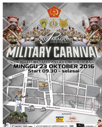
Gambar 2.6 Billboard TNI Festival