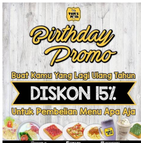
Contoh Unggahan mengenai informasi Discount