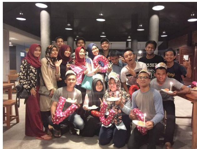
Perayaan Ulang Tahun di Tom's Milk