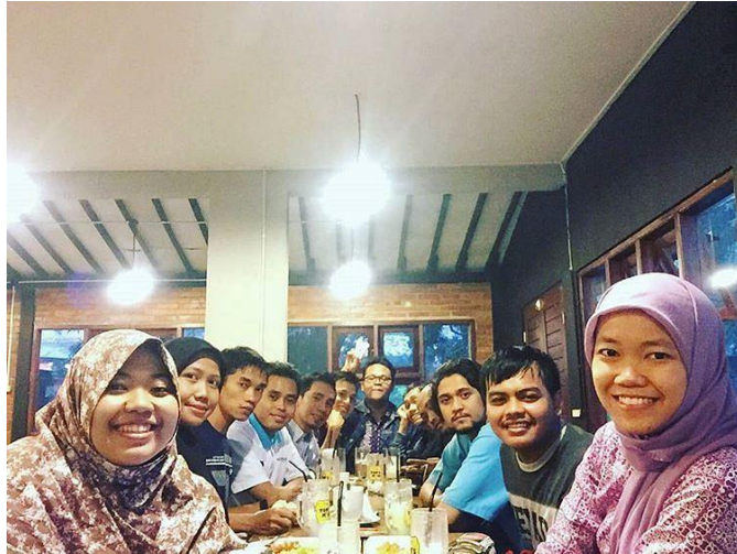
Konsumen yang berkumpul di Tom's Milk