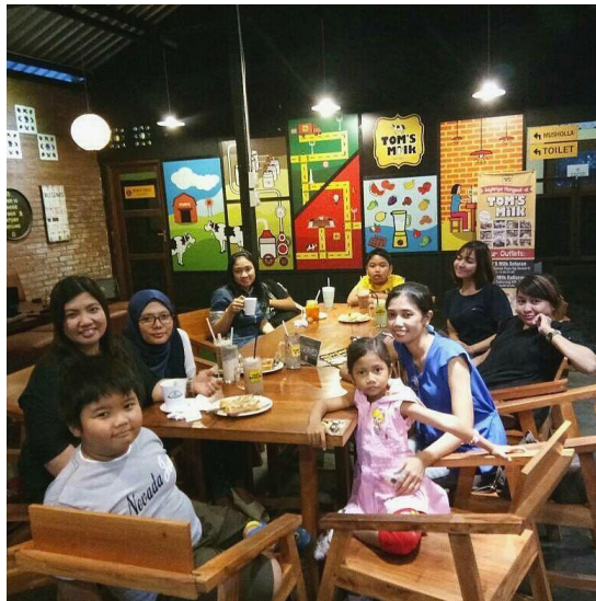
Konsumen yang bersama keluarga