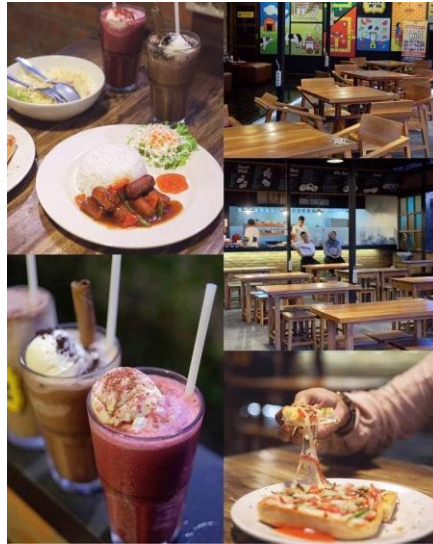
Menu makanan Tom's Milk