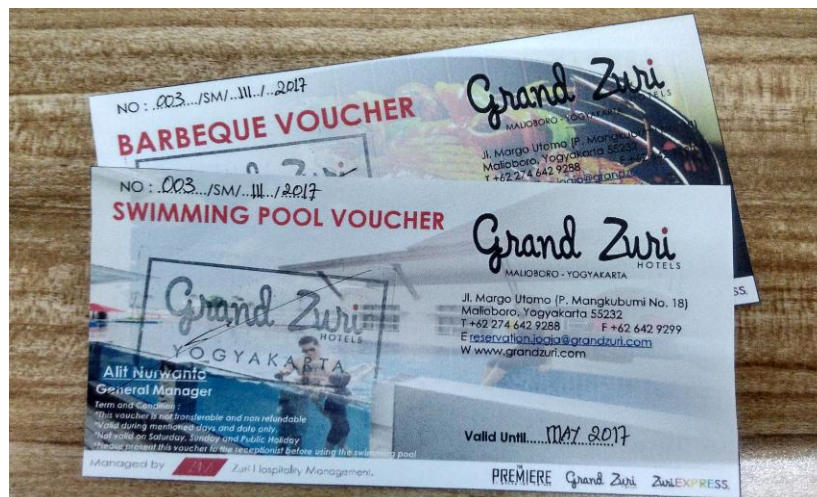
Voucher Hotel Grand Zuri Malioboro Yogyakarta