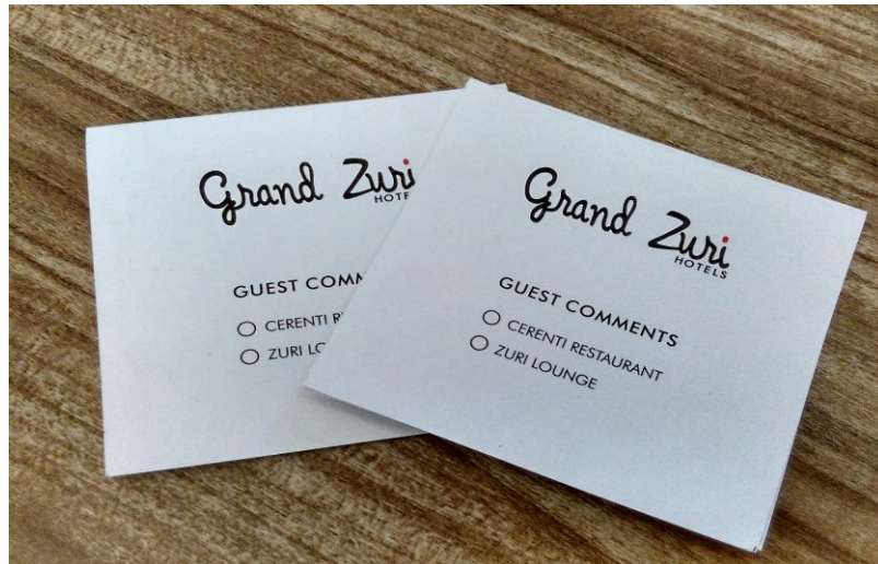
Guest Commend Card Hotel Grand Zuri Malioboro