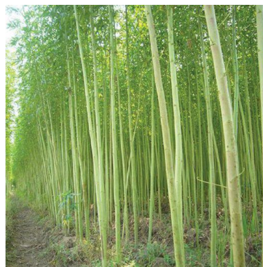
Gambar 2.1 Tanaman kenaf

Jarak yang lebih lebar diperlukan untuk menanam pohon guna produksi biji. Pupuk yang lengkap harus diberikan secukupnya untuk mendapatkan kualitas serat yang baik, batang harus dipanen dalam 3-5 bulan pada saat muncul 10 bunga. Batang yang tidak berdaun lagi direndam dalam air selama 5 – 14 hari untuk menghilangkan bagian-bagian non serat. Hasil serat bias mencapai 1000 – 6000 kg per hektar