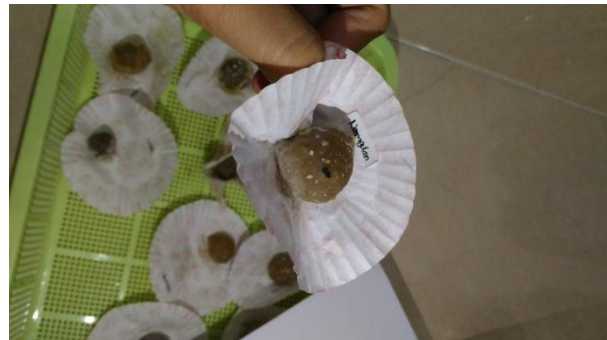
Uji organoleptik sampel bakso tusuk