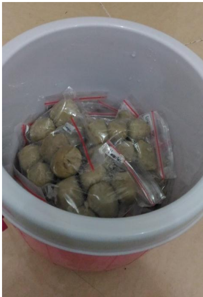
Pengambilan sampel bakso tusuk