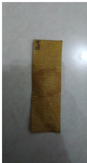
Kontrol positif uji turmerik