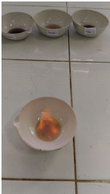
Penambahan H_2SO_4 pekat dan metanol