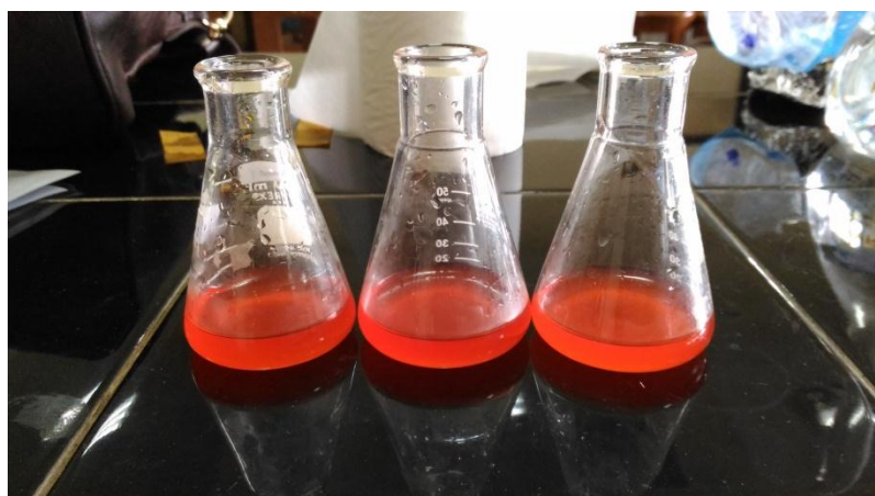
Sampel setelah ditambahkan indikator mo setelah dititrasi berwarna merah muda tipis