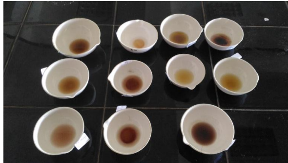
Sampel setelah penambahan H_2SO_4 pekat dan metanol