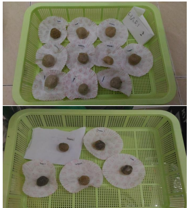
Uji organoleptik pada sampel