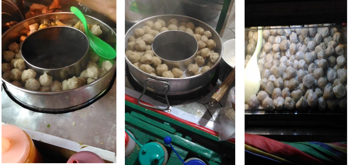
Pengambilan sampel dari pedagang bakso tusuk