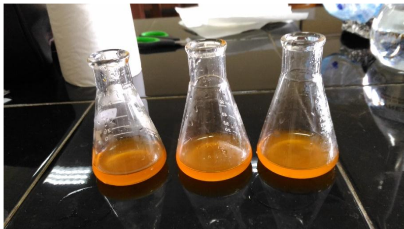
Sampel setelah ditambahkan indikator mo sebelum dititrasi berwarna orange