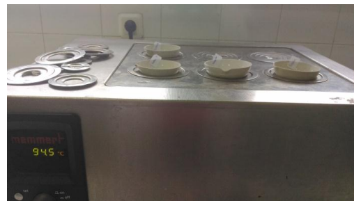
Sampel dipanaskan di penangas air (nyala api)