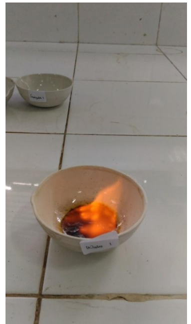
Hasil uji nyala api