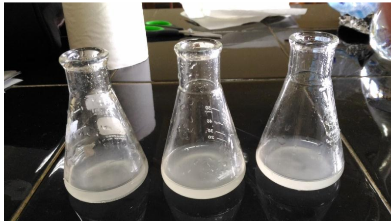
Sampel sebelum ditambahkan indikator mo pada uji titrasi