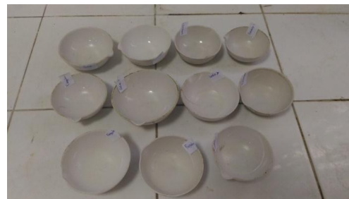
Sampel setelah dipanaskan di penangas air