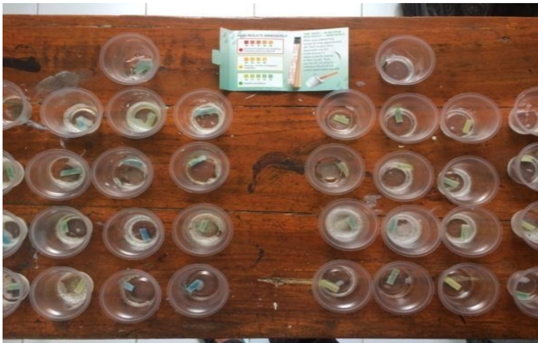
Gambar 5. Pengukuran saliva ( kontrol ) dan saliva ( pembandingan ) dengan dental saliva Ph indikato.