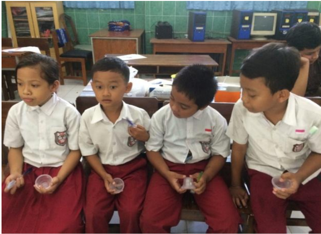
Gambar 4. Pengambilan saliva (Kontrol )