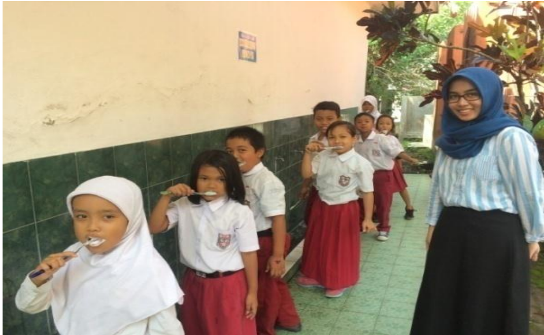
Gambar 1. Siswa-siswai sikat gigi