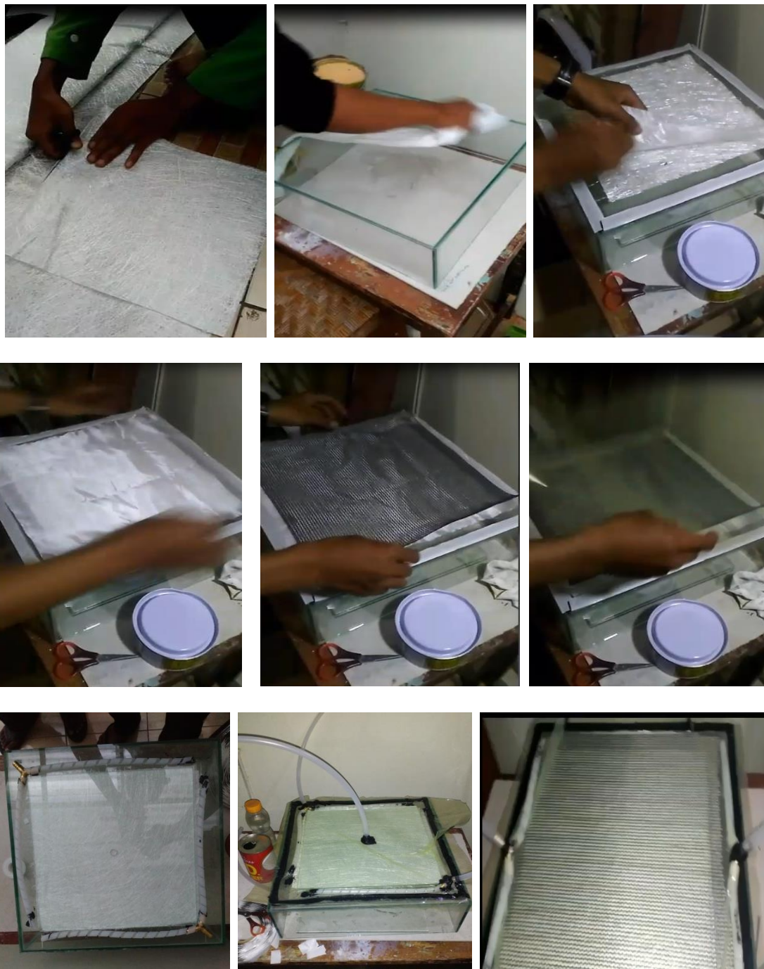
Foto proses uji coba pembuatan panel