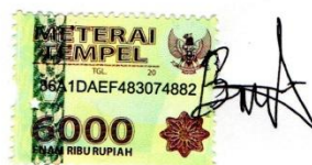
Bhisma Gama Putra