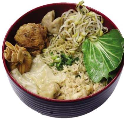
Gambar 2.7 spesial yamie panda asin