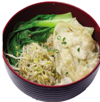
Gambar 2.6 mie siram pangsit rebus

Yamie asin yang terdiri dari 3 pangsit rebus, taugé, bawang goreng, pokcoy beserta kuah siram