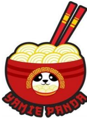
Gambar. 2.1 logo perusahaan Yamie Panda Group