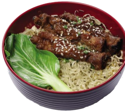
Gambar 2.12 Yamie manis ansio cakar

yang terdiri dari yamie manis, ansio cakar dan pokcoy