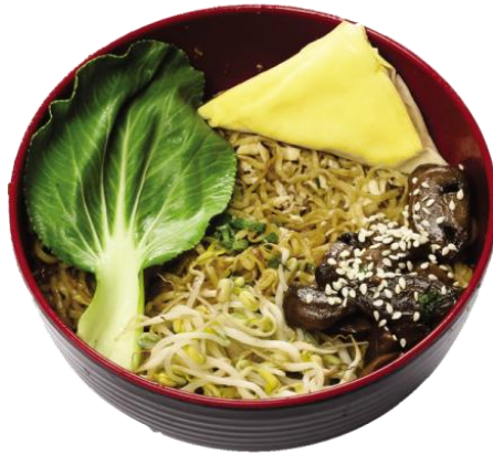
Gambar 2.13 Yamie Manis VG

yamie manis yang terdiri dari, taube, pokcoy, jamur dan samosa.