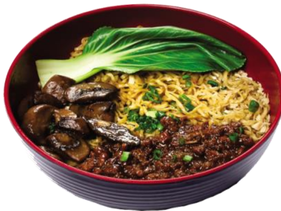
Gambar 2.10 Yamie asin ayam jamur

yamie manis yang terdiri dari ayam manis, jamur beserta pokcoy.