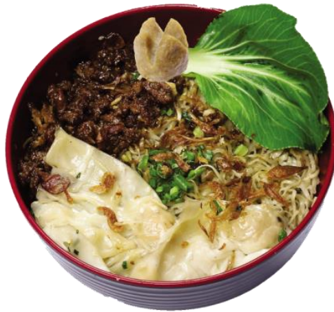
Gambar 2.9 Yamie asin JKT style