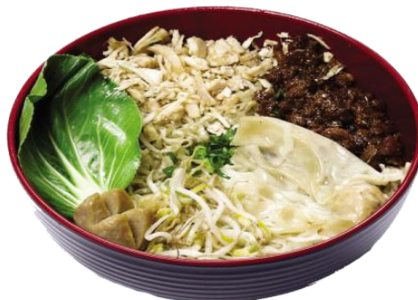
Gambar 2.8 Yamie SKW asin

Yamie asin yang terdiri dari ayam asin, ayam manis, bakso kuah taugé dan pokcoy