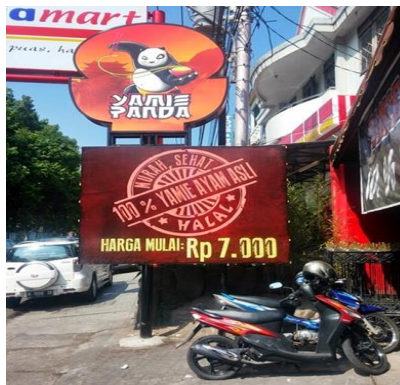
(GAMBAR 2.4 EXTERIOR YAMIE PANDA)

Dalam hal interior dan exterior Yamie Panda restaurant menggunakan konsep bergaya negeri tirai bambu (China) yang identik dengan warna merah serta terdapat lampion yang mempercantik restaurant, serta maskot panda yang memegang mangkok beserta mie.