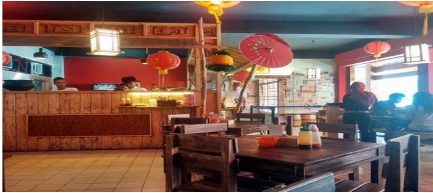
(GAMBAR 2.5 INTERIOR YAMIE PANDA)