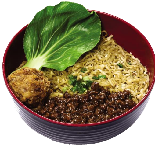
Gambar 2.11 Yamie manis bakso goreng