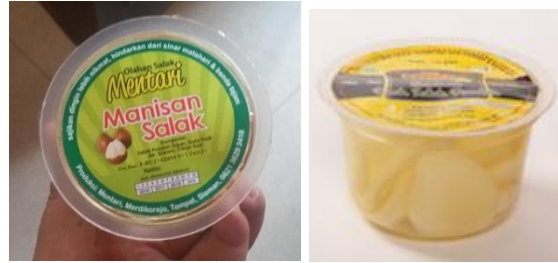
Gambar 5. Manisan salak yang sudah dimasukan kedalam cup