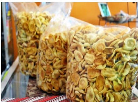
Gambar 2. Keripik salak yang belum dimasukkan dalam kemasan.

Proses produksi keenam adalah penirisan minyak, kegiatan mengeringkan atau menghilangkan minyak goreng yang masih melekat di keripik salak setelah penggorengan. Penirisan minyak menggunakan mesin spinner . Tujuan penggunaan mesin spinner ini adalah untuk mengurangi kadar minyak yang ada pada keripik salak agar keripik lebih kering, lebih renyah dan daya simpan lebih lama. Proses yang terakhir yaitu pengemasan dan pelebelan kemasan. Kemasan yang digunakan untuk mengemas keripik salak yaitu aluminium foil , pengemasan tersebut bertujuan untuk melindungi keripik salak agar tidak mudah rusak dan dapat lebih tahan lama. Setelah dimasukkan kedalam aluminium foil yang sudah diberi lebel dengan merk dagang pengusaha industri olahan salak serta ditimbang, lalu kemasan dipress menggunakan sealer agar kedap udara.