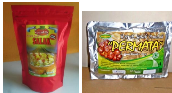
Gambar 3. Keripik salak yang sudah dimasukkan kedalam kemasan 80 gram.