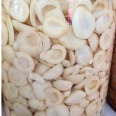
Gambar 4. Manisan salak yang belum dimasukan kedalam cup