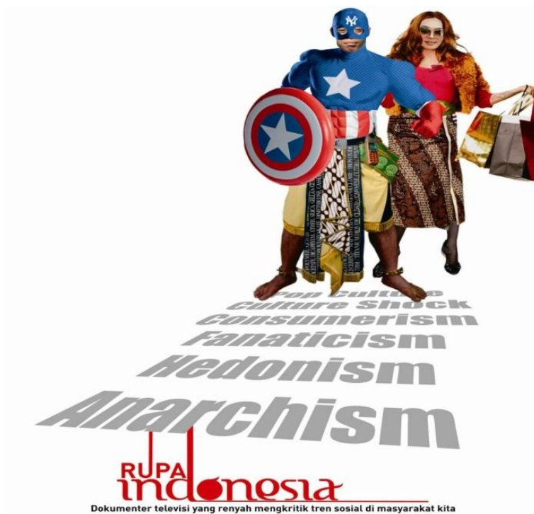
Gambar 2.1 Flyer promosi program Rupa Indonesia

Rupa Indonesia merupakan salah satu program dokumenter televisi yang dimiliki oleh stasiun televisi TvOne. Rupa Indonesia memiliki program yang bersifat tapping yang tidak memerlukan studio untuk rekaman dikarenakan rata-rata program Rupa Indonesia