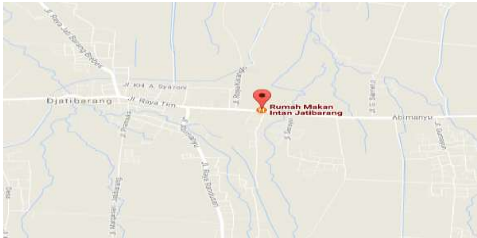
Gambar 5. Lokasi Rumah Makan Intan Jatibarang

Lokasi Rumah Makan Intan beralamat di Jl. Raya Jatibarang – Slawi, Jatibarang, Brebes., telepon (0283) 3322190.