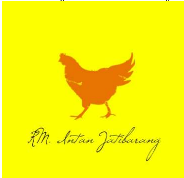
Gambar 7. Logo Rumah Makan Intan Jatibarang