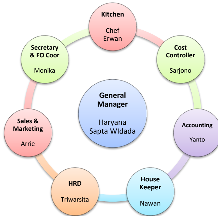
Gambar 2.3. Struktur Tim Branding Cakra Kusuma Hotel