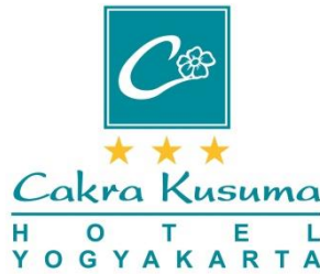
Gambar 2.1. Logo Cakra Kusuma Hotel