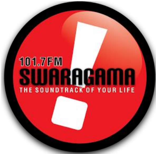
Gambar 2.1 Logo Perusahaan